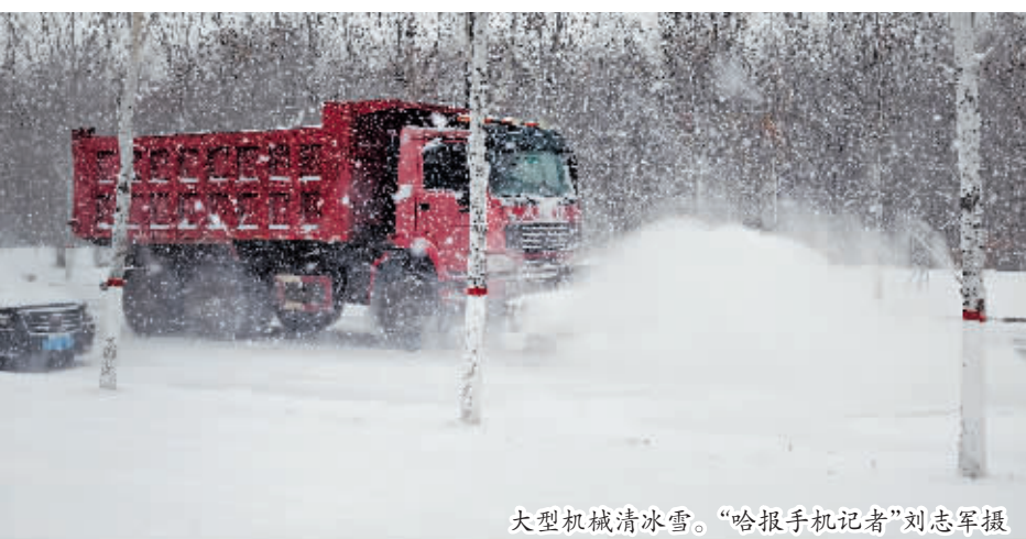
大型机械清冰雪。

截至记者发稿时,降雪仍在继续,各区持续关注校园周边、公交站台、十字路口等关键点位,提升清冰雪作业的精准度。同时按照“全局统筹、先主后次、区街联动”的原则,组织各辖区街道办事处和市场化作业单位持续推进背街背巷清冰雪工作,确保清冰雪时效,保障背街背巷居民出行顺畅,环境整治。