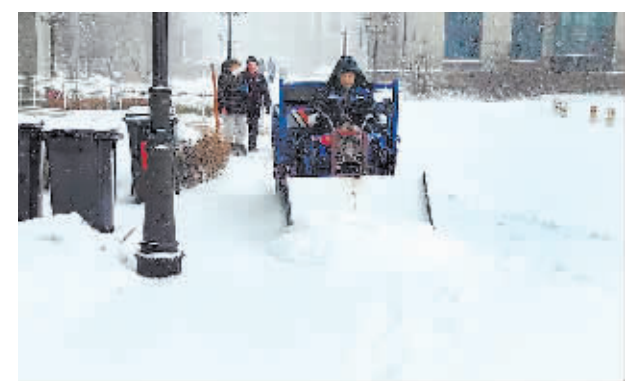
三轮车变身清雪车。

本报讯(记者 刘述波)将铲车的前斗挂上滚刷成为扫雪车,在三轮车前安装铁板“变身”推雪车……连日来,面对强降雪,冰城各物企为提高清雪效率,纷纷通过对原有机械或车辆的改造,进一步增加了机械清雪的能力。