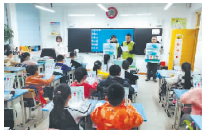
街道工作人员向小学生宣传垃圾分类知识。

本报(张文丞 记者 霍亮)“同学们,用过的纸巾是什么垃圾?应该如何处理?”为充分发挥青少年儿童在环境保护中带动家庭、辐射社会的重要作用,更好地推动全民参与垃圾分类工作,近日,道里区尚志街道联合尚志小学校组织开展“垃圾分类进校园,小手拉大手”垃圾分类科普活动。