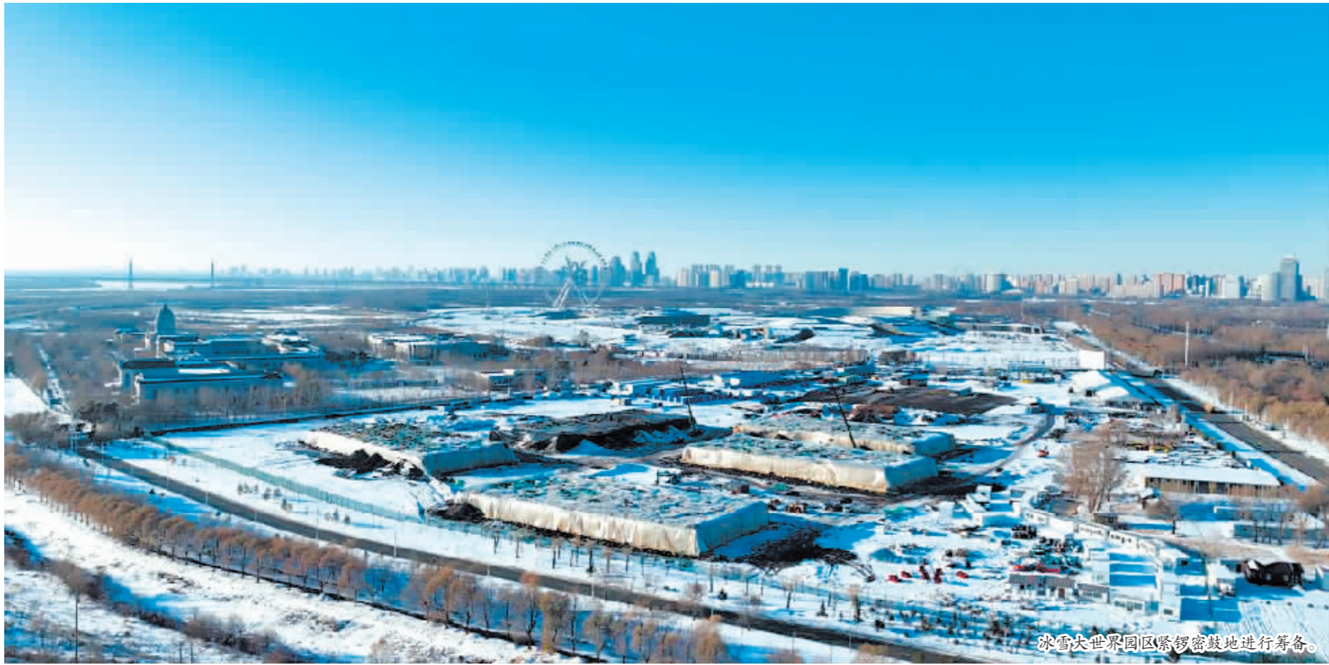
冰雪大世界园区紧锣密鼓地进行筹备。

本报(郑蕊卓 记者 张鸣霄)雪落冰城,小雪将至,哈尔滨满冬天的味道。随着气温逐渐走低,哈尔滨冰雪大世界梦幻之旅即将再度开启。为了让冰雪大世界尽早同市民和游客“见面”,哈尔滨冰雪大世界股份有限公司启用高科技存冰,提前建设哈尔滨冰雪大世界。目前,园区正在紧锣密鼓地进行筹备工作,力争在12月中下旬,比往年提前将一个美轮美奂的冰雪王国完美呈现。