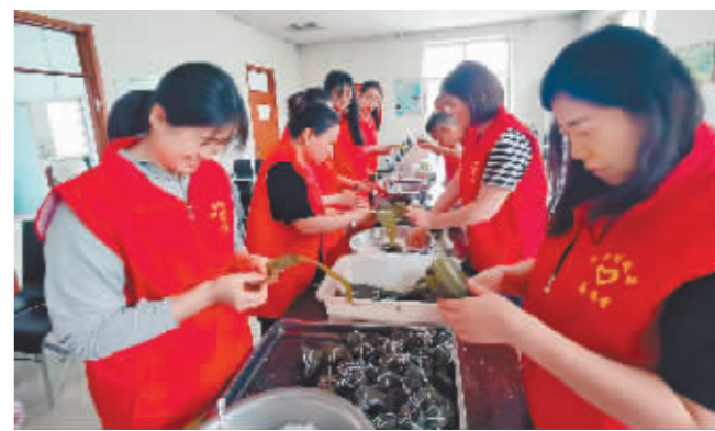
志愿者开展“我们的节日·端午”活动。

本报(刘婧婧 刘峰 记者 罗彦坤)推动移风易俗,倡树文明新风。今年以来,宾县结合“创城”活动,坚持以培育和践行社会主义核心价值观为根本,全方位、多维度开展乡村文明建设行动,绘就信念笃诚、正气充盈、崇德向善的乡村新画卷。