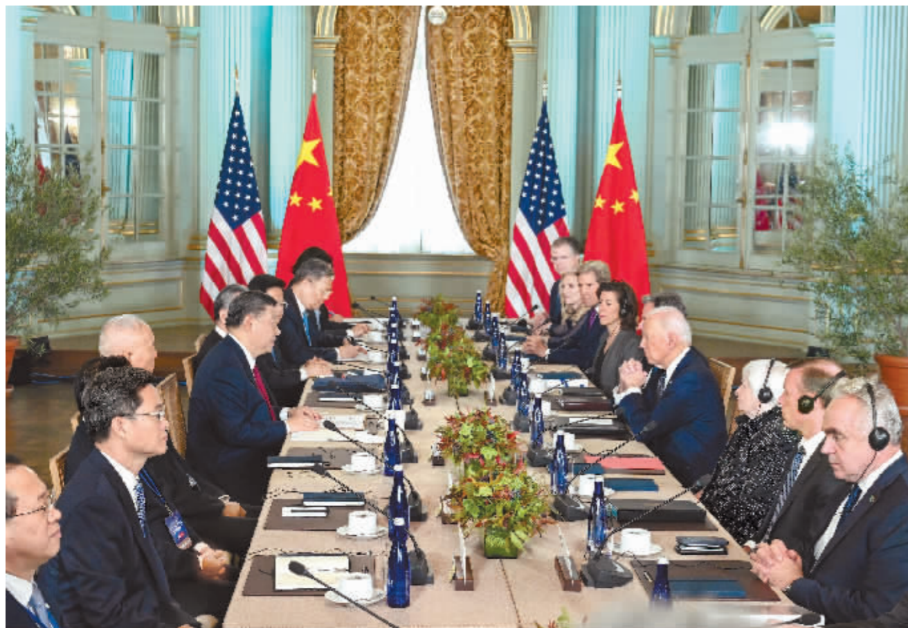
当地时间11月15日,国家主席习近平在美国旧金山斐洛里庄园同美国总统拜登举行中美元首会晤。