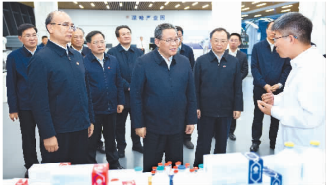
11月14日至16日,中共中央政治局常委、国务院总理李强在黑龙江、吉林调研。这是11月14日,李强在哈尔滨新区江北一体发展区调研。

新华社长春11月16日电 中共中央政治局常委、国务院总理李强11月14日至16日在黑龙江、吉林调研。他强调,要深入贯彻落实习近平总书记在新时代推动东北全面振兴座谈会上的重要讲话精神,坚持改革创新,激发内生动力,推动新时代东北全面振兴取得新突破。