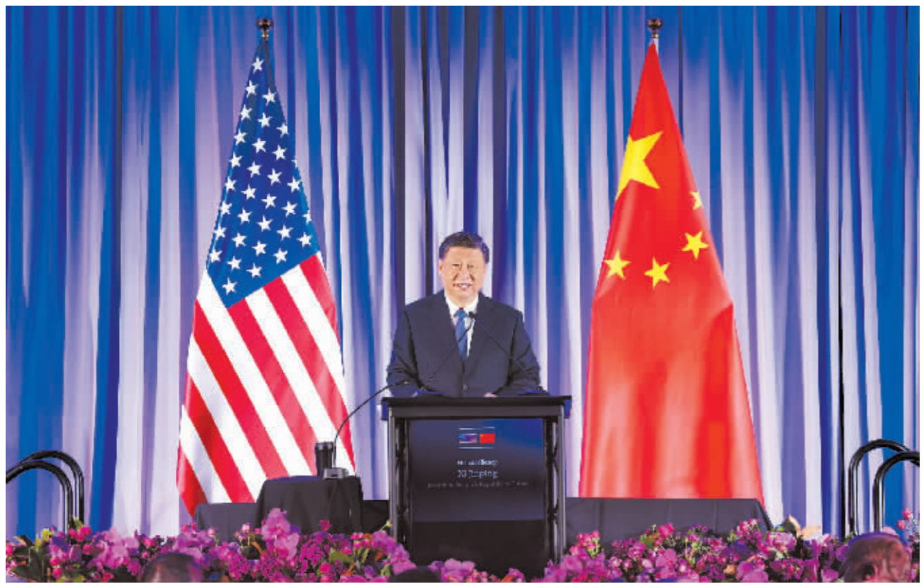
当地时间11月15日晚,国家主席习近平在美国旧金山出席美国友好团体联合举行的欢迎宴会。这是习近平发表重要演讲。

新华社旧金山11月15日电(记者孙浩 郑开君 宿亮)当地时间11月15日晚,国家主席习近平在美国旧金山出席美国友好团体联合举行的欢迎宴会。