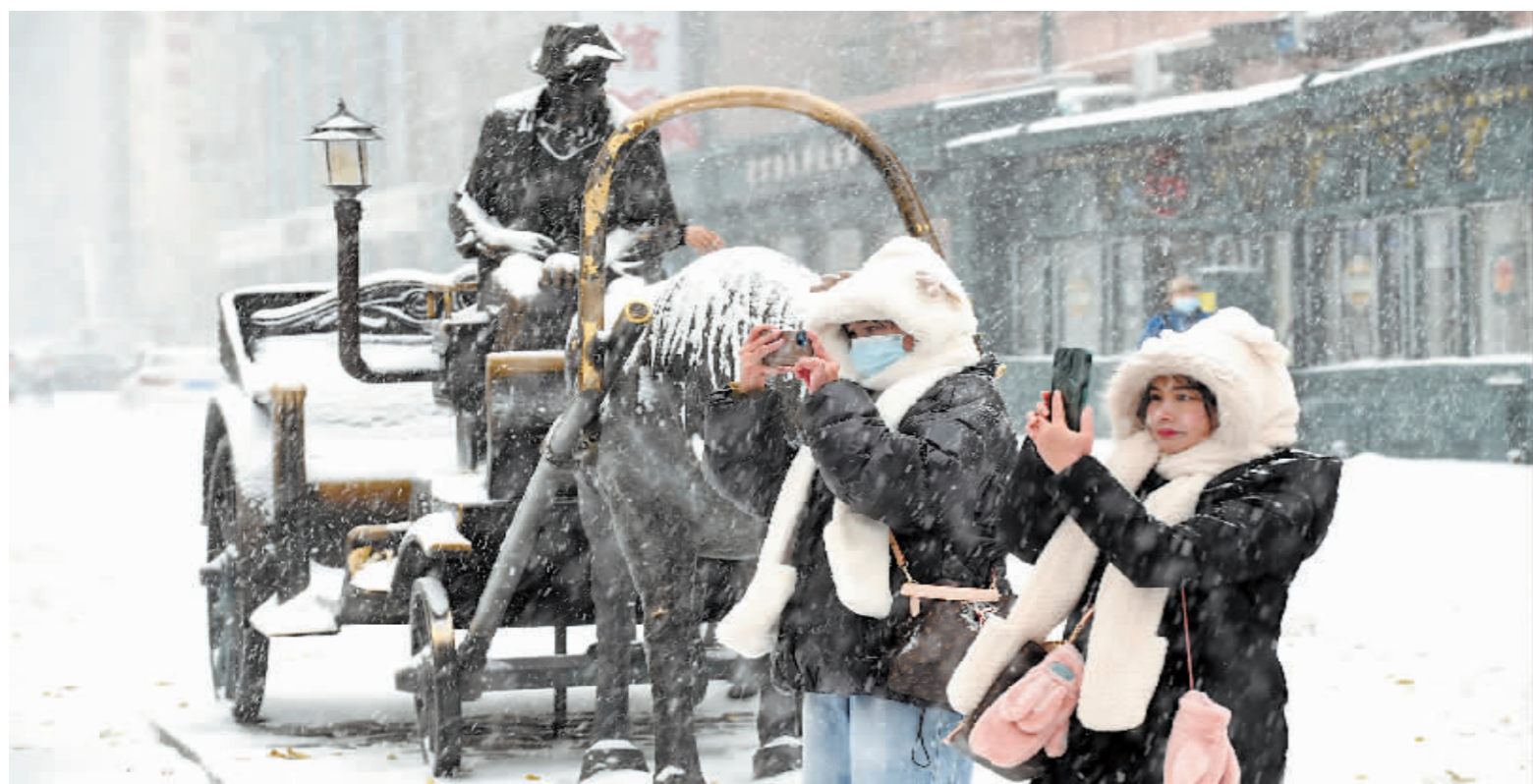
游客雪中打卡中央大街铜马车。