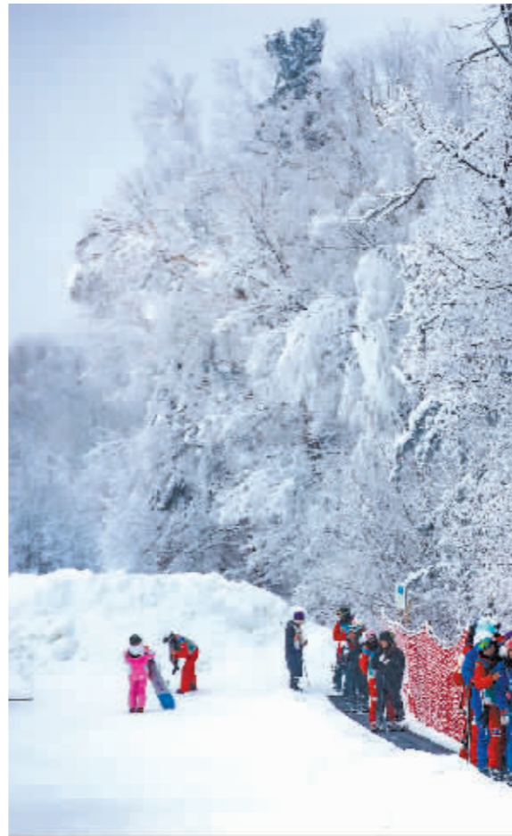
雪友在亚布力阳光滑雪场畅滑。

庄园还将举办伏尔加冰雪艺术节系列活动,有阿什河冰面上同创拓彩冰版画、中俄艺术家红帆岛上的冰雪舞蹈、彼得洛夫艺术宫金色大厅的音乐舞会等,是伏尔加冰雪文化的展示。伏尔加庄园丰富的冰雪文化、冰雪娱乐和冰雪体验,必将为游客留下梦幻般的回忆。