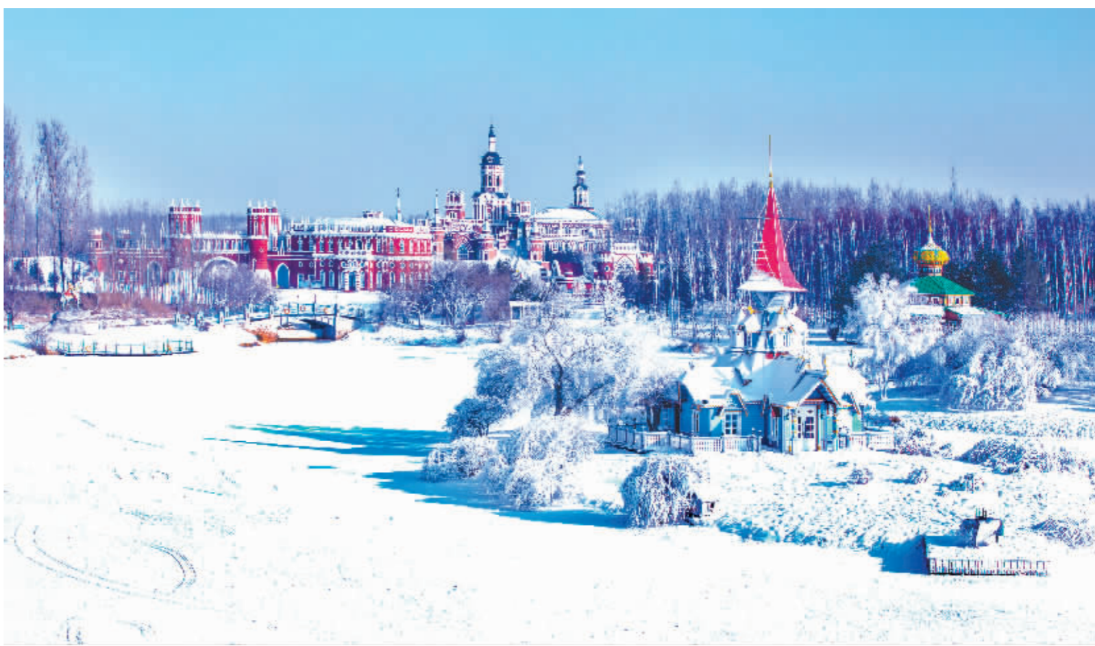
雪后伏尔加庄园银装素裹。