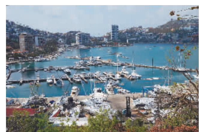
这是 11 月 10 日在墨西哥阿卡普尔科拍摄的遭到破坏的船只。飓风“奥蒂斯”近日在墨西哥南部太平洋沿岸登陆,对格雷罗州度假胜地阿卡普尔科造成严重破坏。