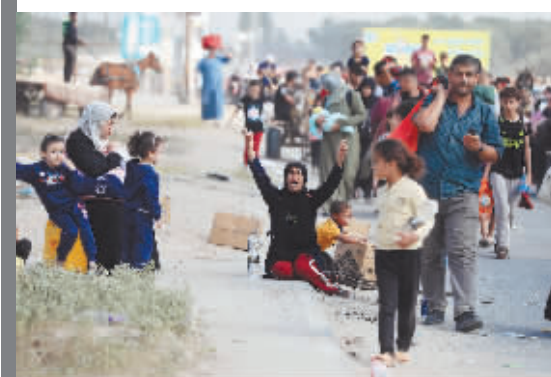
加沙地带北部的民众被迫向南撤离。