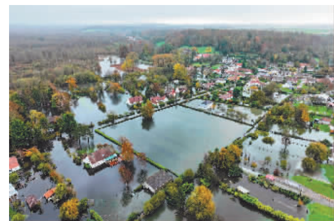
这是 11 月 10 日在法国加来海峡省航拍的遭受洪灾的区域。受强降雨影响,法国北部几十个城镇遭遇洪水。