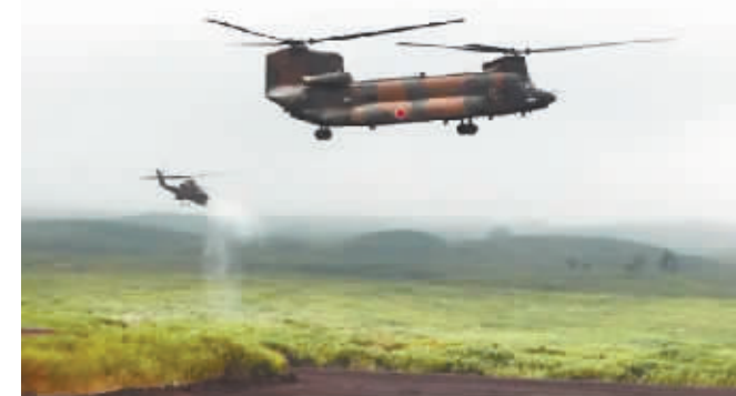
在日本静冈县演习场,日本自卫队举行演习。(资料图)

据新华社电 日本媒体 10 日报道,日本航空自卫队位于静冈县的一座基地周边多处水体检测出全氟和多氟烷基物质超标后,静冈县决定对县内 33 处河流展开水质调查,以检测其中是否含有这类有害物质。