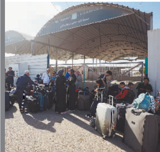
11月10日,外国护照持有者在拉法口岸加沙一侧等待前往埃及。