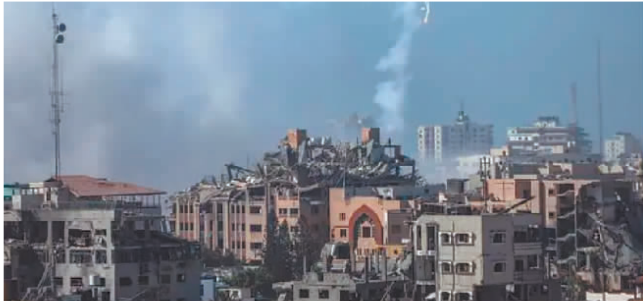
加沙城建筑遭以色列军队空袭后升起浓烟。

为求一线生机,加沙地带北部大批民众不得不向南部逃离。连接加沙地带和埃及的拉法口岸 10 日关闭,暂时不清楚何时重新开放。