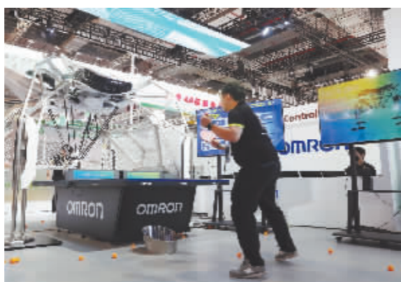
工作人员(右)在第六届进博会上展示欧姆龙公司展出的第八代 FORPHEUS 乒乓球教练机器人。