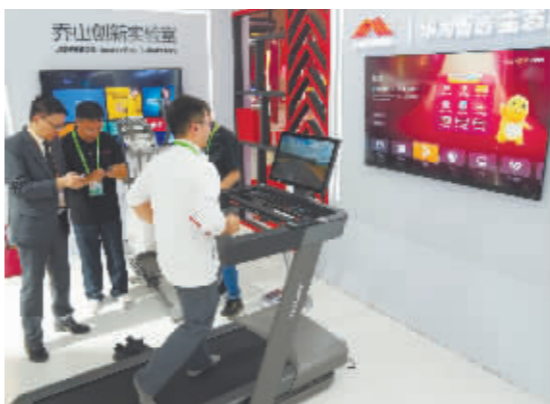
在第六届进博会消费品展区,泰山展台拍摄的泰山华为智选合作款高端智能跑步机。