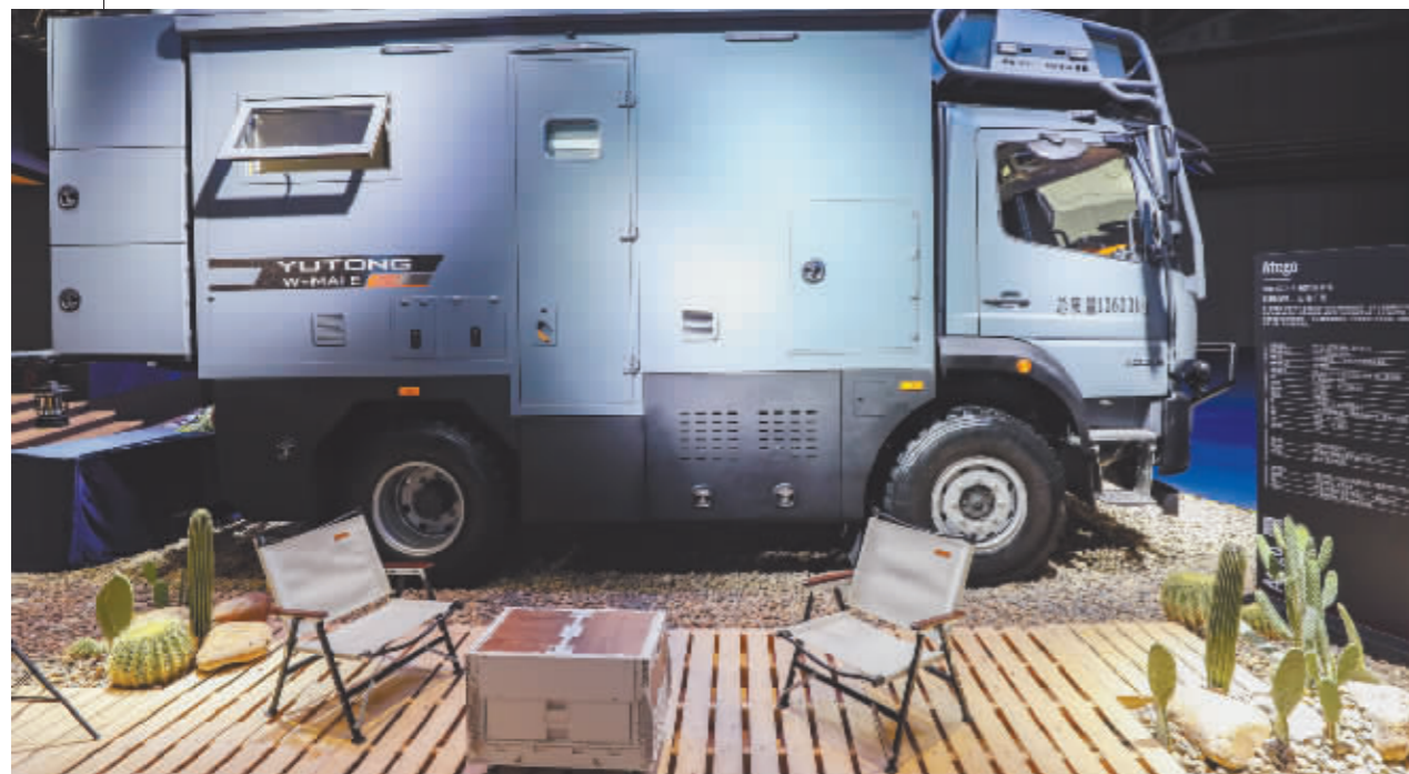
11月5日,在第六届进博会汽车展区,奔驰 Atego 1023 4x4 越野旅居车迎来中国首展。

11月5日,第六届中国国际进口博览会在国家会展中心(上海)开幕,众多首发首展的新科技、新成果、新展品亮相本届进博会。