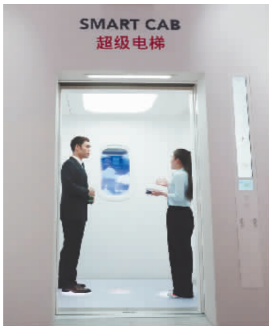
工作人员(右)在第六届进博会上向参观者介绍奥的斯公司全新推出的超级电梯。