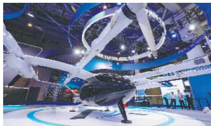
在第六届进博会汽车展区,御风未来自主研发的载人电动垂直起降飞行器 Matrix 1 迎来全球首展。