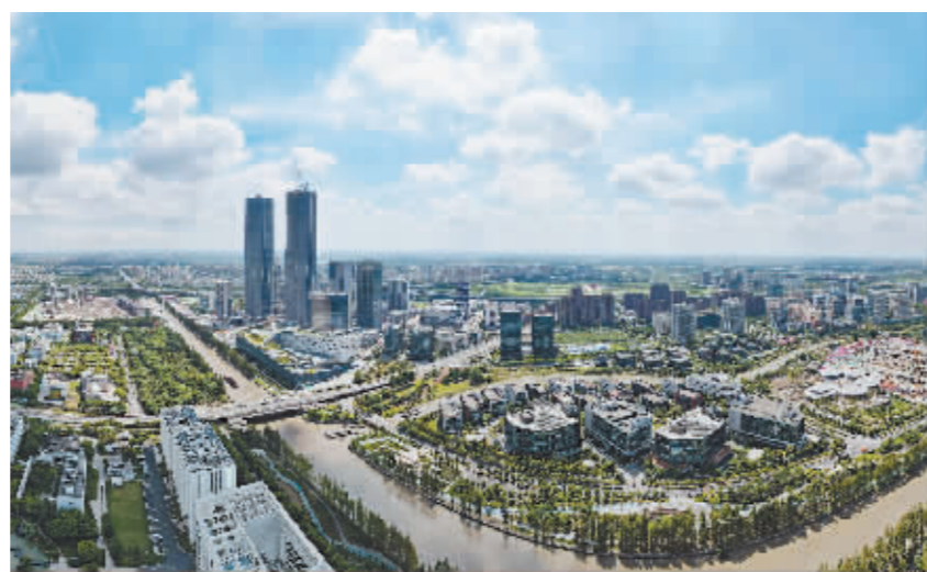
下图:中国(上海)自由贸易试验区张江片区。