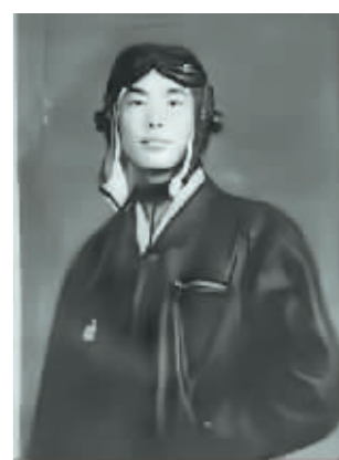
杨会录烈士证,是传播红色文化的重要载体,具有特殊的历史价值。哈尔滨烈士陵园始终高度重视文物保护、征集工作,充分发挥红色资源富集优势,从文物中挖掘红色故事,大力弘扬英雄烈士的丰功伟绩和高尚品格,深入营造缅怀英烈、学习英烈的良好社会氛围。

弘扬英烈精神 赓续红色血脉 主办 哈尔滨市退役军人事务局 哈尔滨烈士陵园管护中心 哈尔滨日报社