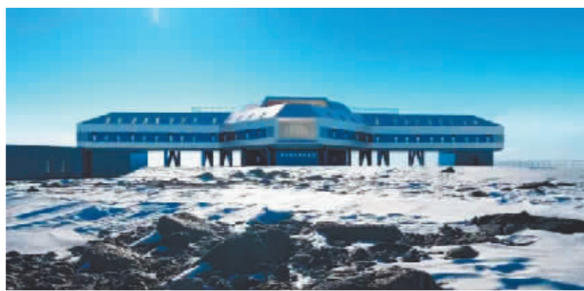
新考察站效果图。

“建设罗斯海新站是本次考察最突出的亮点。”在日前举行的中国第40次南极科考媒体通气会上,国家海洋局极地考察办公室副主任龙威表示,新站是新时代我国建立的第一个常年考察站,也是继长城站、中山站之后第