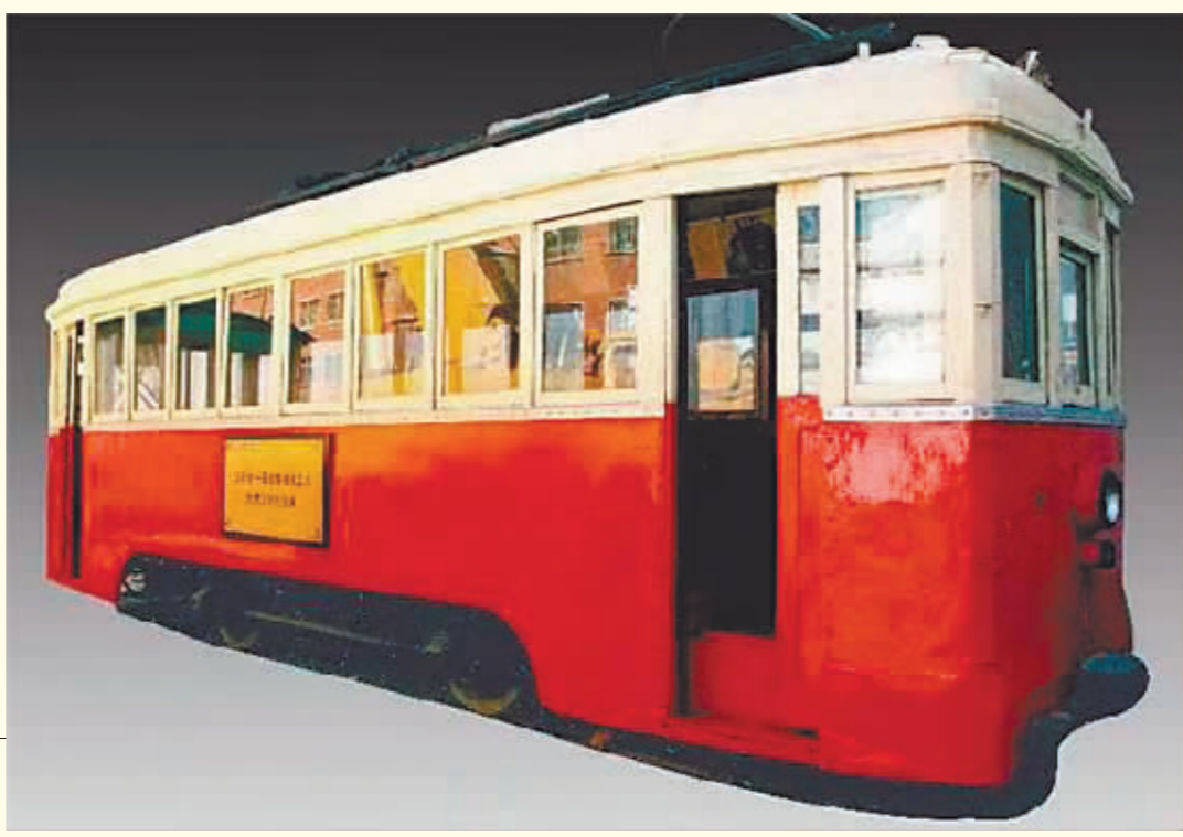
赵一曼领导哈尔滨电车工人罢工时的电车。

学校,与邓颖超是同学。1929年,在中东铁路事件后,郭隆真被派到哈尔滨,出任中共哈尔滨市委委员,负责领导工人运动。为了更好地掩护党组织开展革命活动,郭隆真以工人家属的身份与先期到哈尔滨的共产党员李梅五假扮夫妻,组成临时家庭,并租住在偏子八道街29号大院一座板夹泥的平房内。当时,李梅五已是中东铁路总工厂机器分厂的工人,因为中东铁路工厂不招收女工,郭隆真就在工厂大门口摆了一台旧缝纫机,给工人们缝补衣服和洗油布(工作服),以此作掩护与工人以及工人家属接触,在工人中有一定的影响力。在刘少奇领导下,郭隆真参与组织了多次铁路工人大罢工。