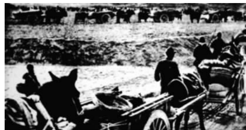
解放战争时期,哈尔滨人民群众积极支援前线。

样写的:“我党在东北的工作重心是群众工作。必须使一切干部明白,国民党在东北一个时期内将强过我党,如果我们不从发动群众斗争、替群众解决问题、一切依靠群众这一点出发,并动员一切力量从事细心的群众工作,在一年之内,特别是在最近几个月的紧急时机内,打下初步的可靠的基础,那么,我们在东北就将陷于孤立,不能建立巩固根据地,不能战胜国民党的进攻,而有遭遇极大困难甚至失败的可能;反之,如果我们紧紧依靠群众,我们就将战胜一切困难,一步一步地达到自己的目的。群众工作的内容,是发动人民进行清算汉奸的斗争,是减租和增加工资运动,是生产运动。”12月31日中共中央再次致电东北局:“如果你在东北今冬明春能发动广大深刻的群众运动,像大革命时南方的农民运动与工人运动那样,又有十余万主力部队和二十万地方部队与之配合,那你们就不仅能够在东北站住脚,而且能争取对国民党的优势,否则你们在东北的地位就将是极危险的。”