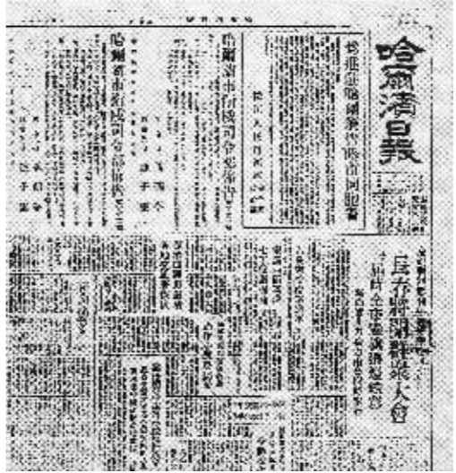
解放战争时期的《哈尔滨日报》。

1925年10月召开的中共扩大执委会决议案中提出:“中国革命运动的将来命运,全看中国共产党会不会组织群众,引导群众。”而唤醒人民觉悟的重要方式就是发挥舆论的强大作用。