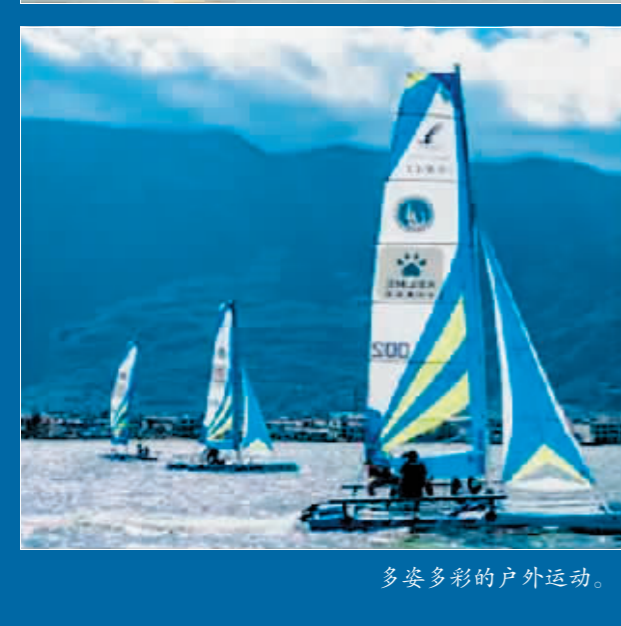
多姿多彩的户外运动。