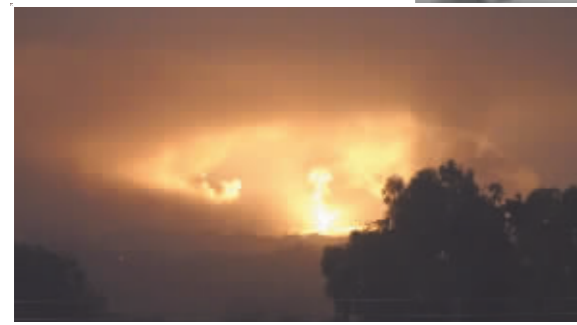
从以色列国防军发布视频中截取的照片显示,10月27日晚,以军进入加沙地带开展地面行动。