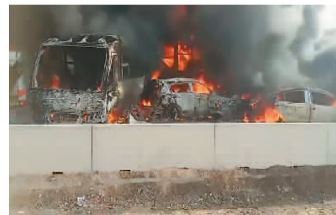
这张来自社交媒体的照片显示的是10月28日埃及布海拉省的多车相撞事故现场。

据新华社电 据埃及《金字塔报》网站28日报道,位于首都开罗以北的布海拉省当天发生一起多车相撞事故,目前已造成35人死亡、53人受伤。