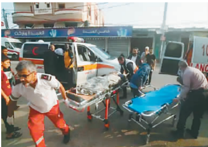
在加沙地带南部城市拉法,伤者被送往医院接受治疗。

巴以新一轮冲突 26 日进入第 20 天。以色列持续空袭加沙地带造成大量人员伤亡,而迄今只有少量援助物资获准运入,加沙地带食品、燃油和医疗物资严重短缺,人道主义灾难日益严重。