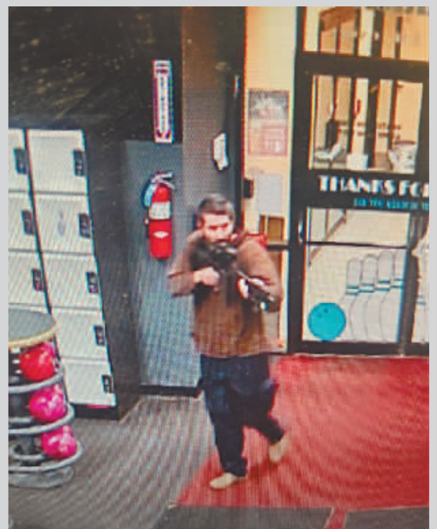
10月25日在美国缅因州路易斯顿拍摄的一名持枪男子(视频截图)。