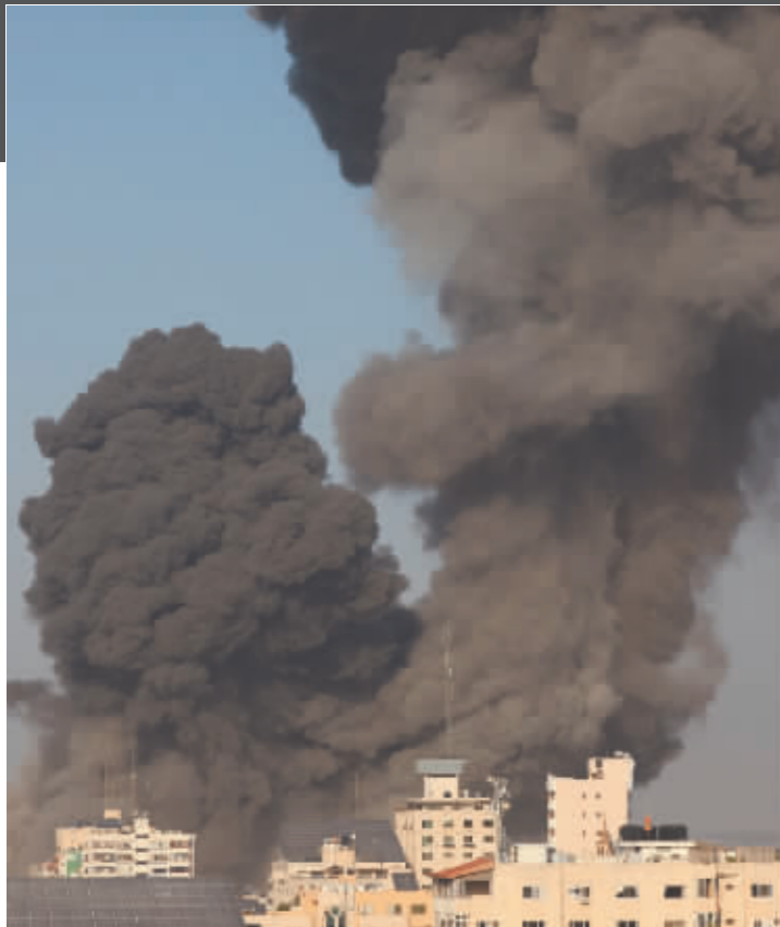
以色列轰炸加沙地带后升起的浓烟。