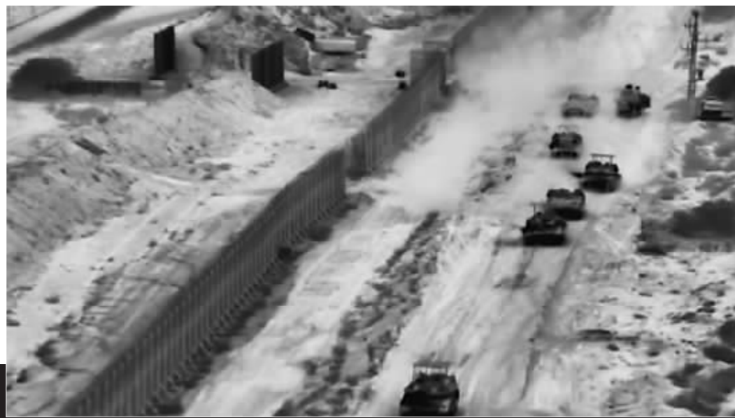
从以色列国防军发布的视频中截取的照片显示,10月26日,以军在加沙地带北部开展行动。