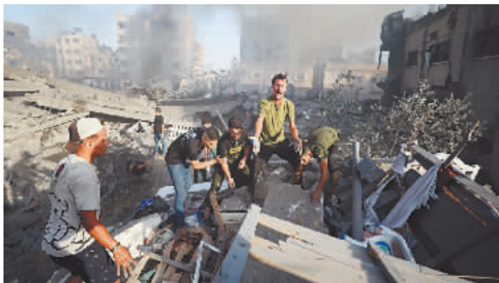
在加沙城,人们在建筑废墟中搜寻伤者。