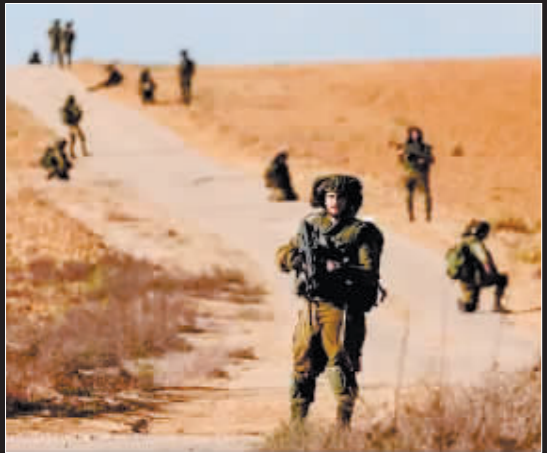
在以色列南部加沙地带巡逻的以色列士兵。