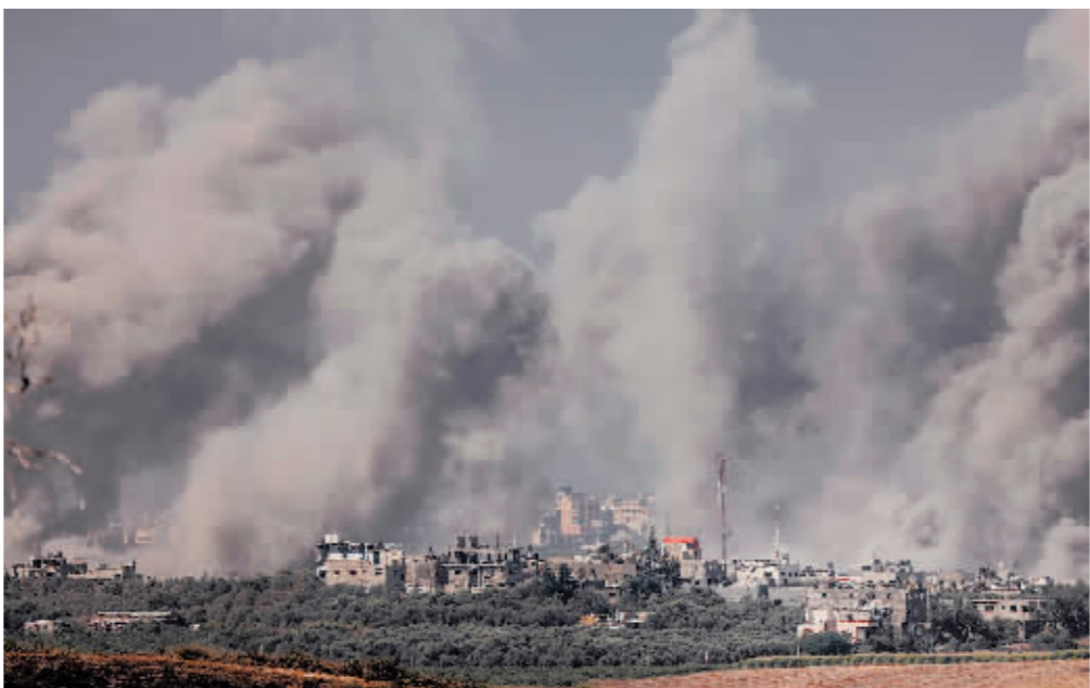
加沙地带北部遭以色列空袭后升起的浓烟。

方惯常既不承认也不否认。以色列《耶路撒冷邮报》报道,以军这次罕见通报军事行动。据这家媒体报道,基尼烈湖以东多地24日晚响起警报。以色列国防军说,有两枚火箭弹从叙利亚境内发射,落入空旷地带。据以军24日晚证实,以色列炮兵从戈兰高地打击来袭火箭弹的发射地。戈兰高地是叙利亚西南部一块狭长地带,以色列在1967年第三次中东战争中占领这一战略要地,拒绝归还叙利亚。在黎巴嫩方向,以色列24日出动一架直升机打击两国边界黎方一侧侯拉镇附近一处哨所,以回应火箭弹从黎巴嫩射向以色列一处军事设施。据黎巴嫩电视台报道,以方袭击没有导致人员伤亡。同一天,黎巴嫩总理纳吉布·米卡提视察在黎南部边境驻扎的部队。