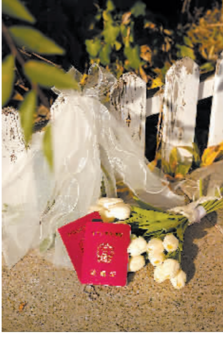
“土豆姐”晒出的结婚证书。

女士的感受是“哈尔滨的‘东北币’真禁花”!领结婚证那天,她和老公想庆祝一下,在红专街附近一个回民饭店点了5个菜。菜上来之后发现“量巨大,像吃席一样,牛肉的锅包肉太香了,扒肉条也软烂,最喜欢的酥黄菜玩命吃,才吃了一半,最后打包一大堆,花了140块钱。”而这只是开始,他们还在中央大街的高档西餐厅吃了一顿438元的双人餐,里边有雪花牛排、罐虾、马哈鱼、沙拉、蘑菇汤,“量大、好吃,餐厅装修豪华,旁边还有人吹萨克斯,就这些东西在北京差不多档次的老莫餐厅得要你1000多!还有白杨包子,俩人不到50块钱,那猪肉包子和牛骨汤辣棒;偏盒子烧烤也好吃,哈尔滨的烧烤比淄博一点不差;还吃了一个砂锅小店,人太多都没挤进去,门口吃的,扒肉、砂锅、油饼,吃撑了花了43块钱。天啊,我上次看到这样的物价还是在1999年!”