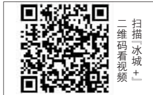
扫描二维码 查看视频

据了解,目前哈尔滨学院学生们热情高涨,已有近千名学生报名,利用课余时间积极参与到活动中来。