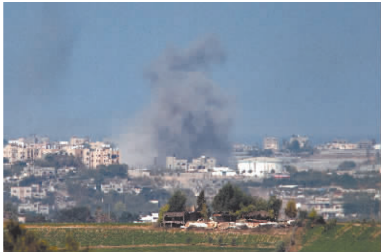
10月15日在加沙边境以色列一侧拍摄的以色列轰炸加沙地带后升起的浓烟。

以色列和黎巴嫩的边境局势同样升级。据路透社报道,黎巴嫩真主党15日对多个以色列军事据点等地发动袭击。作为报复,以色列炮击黎巴嫩南部地区。