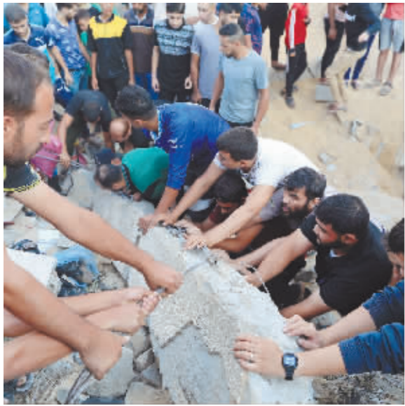
10月16日,在加沙地带南部城市汗尤尼斯,人们在遭以色列袭击后的建筑废墟中救援伤者。

巴勒斯坦伊斯兰抵抗运动(哈马斯)本月7日从加沙地带向以色列境内军民目标发起突袭,招致以色列猛烈报复加沙地带。本轮冲突已造成巴以共计4000多人丧生,逾万人受伤。