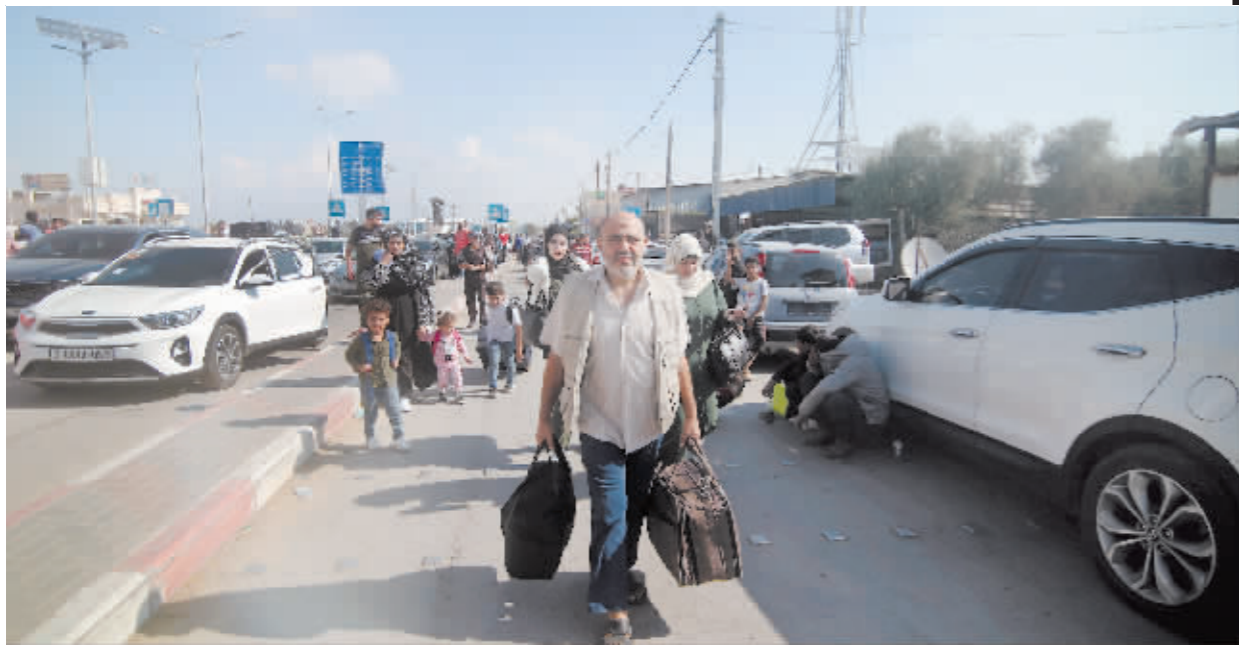
10月16日,人们在加沙地带南部的拉法口岸前等待撤离加沙地带。

以色列对巴勒斯坦加沙地带的大规模军事报复和全面封锁截至17日已经持续十天,将近2800人死于以军轰炸和炮击,上万人受伤,当地人道主义状况愈发严峻。居民用水日益困难,一些人只能喝咸水。大量尸体来不及下葬,连冰激凌车都用来临时存放尸体。墓地越来越不够用,只能多人合葬。