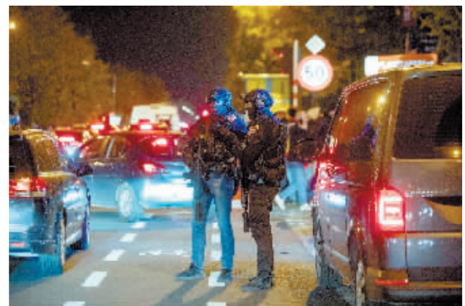
10月16日,警察在比利时布鲁塞尔博杜安国王体育场外警戒。

新华社布鲁塞尔10月16日电 比利时首都布鲁塞尔16日晚发生枪击事件,造成两名瑞典球迷死亡,另有一人受伤。比利时国家危机中心随后宣布,布鲁塞尔大区的安全警戒级别提升至最高级4级。比利时联邦检察官办公室发言人当晚说,一名枪手在布鲁塞尔街头向民众开枪,造成人员伤亡。嫌疑人目前在逃,其身份尚不清楚。一名自称凶手的人在社交媒体上宣称自己效忠极端组织“伊斯兰国”。比利时首相德克罗将这一事件定性为“恐怖袭击”,并呼吁民众提高警惕。比利时国家危机中心当晚宣布,布鲁塞尔大区的安全警戒级别提升至最高级4级,民众要提高安全意识,减少不必要外出。事发后,在布鲁塞尔进行的比利时队与瑞典队的足球比赛在结束上半场后被紧急叫停。中国驻比利时大使馆16日晚提醒在比中国公民近期密切关注当地安全形势,提高安全防范意识,减少不必要外出,避免前往风险区域;经营者注意加强餐馆、店铺、住所等安保措施,确保人员安全。