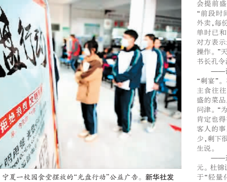
宁夏一校团食堂摆放的“光盘行动”公益广告。

记者调研了解到,主食浪费的“老毛病”难以根治,既有部分消费者观念还需转变的原因,也与目前餐饮机构经营、外卖平台管理等方面存在的一些问题有关。——怕被打差评,多给更保险。