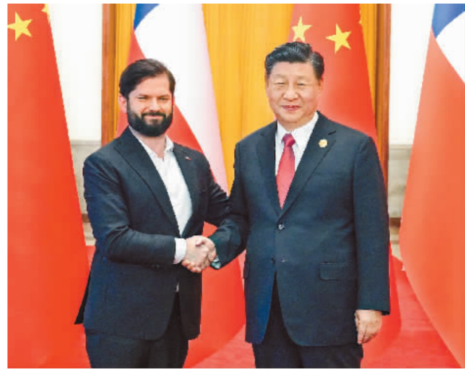
10月17日上午,国家主席习近平在北京人民大会堂同来华出席第三届“一带一路”国际合作高峰论坛并进行国事访问的智利总统博里奇举行会谈。

果,共同绘就联结世界、美美与共的壮阔画卷。这些成就是各国政府、企业和人民用勤劳、智慧、勇气干出来的!让我们向共建“一带一路”所有的参与者、建设者致敬! 习近平强调,共建“一带一路”追求的是发展,崇尚的是共赢,传递的是希望。唯有自强不息、不懈奋斗,才能收获累累果实,才能建立利在千秋、福泽万民的长久之功。这是我们这一代政治家对当代人和后代人的责任。共建“一带一路”走过了第一个蓬勃十年,正值风华正茂,务当昂扬奋进,奔向下一个金色十年! (下转第七版)