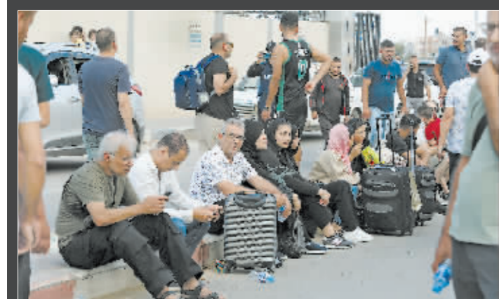
外国公民在加沙地带和埃及边境的拉法口岸等待撤离。