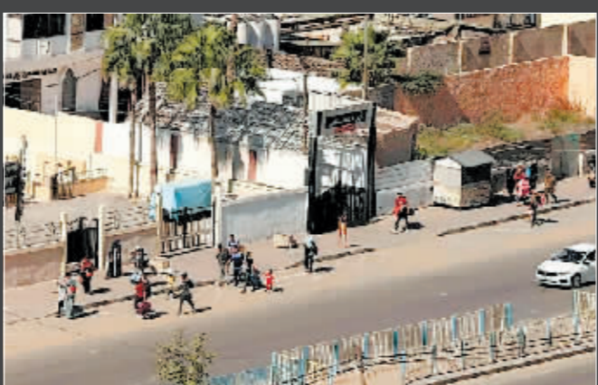
部分加沙民众向南撤离。