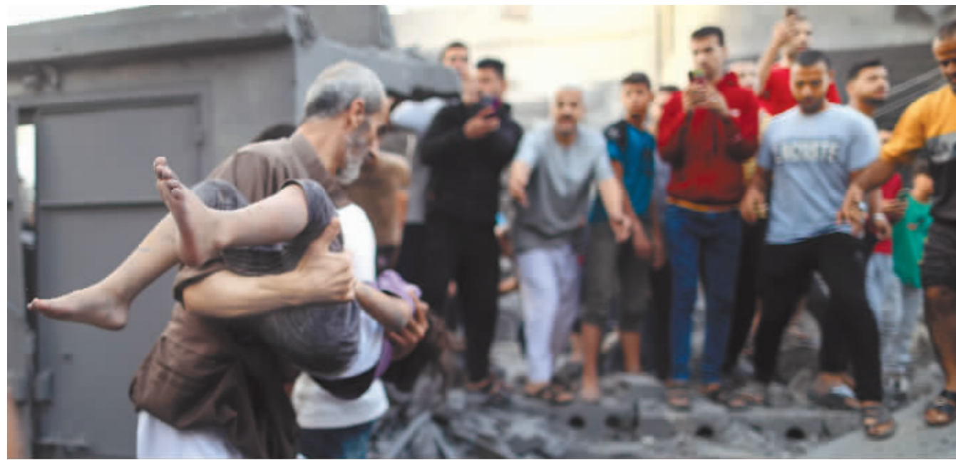
10月14日,在加沙地带南部城市汗尤尼斯,人们在遭以色列空袭炸毁的建筑中救援。

据黎巴嫩媒体14日报道,以色列军队当天对黎巴嫩南部进行了炮击,造成2名黎巴嫩平民死亡。报道说,当天下午,黎巴嫩真主党和以色列军队在黎以边境地区继续交火。黎巴嫩真主党向以色列占领的萨巴阿农场发射炮弹和火箭弹,以军的炮弹击中黎南部边境一村庄,造成一对黎巴嫩老年夫妇死亡。另据黎巴嫩真主党当天发表的声明,该组织一名成员在以色列军队的袭击中丧生。这是黎巴嫩真主党在一周内对萨巴阿农场第二次发起行动。黎巴嫩真主党8日发表声明说,其军事组织向萨巴阿农场发射了炮弹和火箭弹,以声援哈马斯和巴人民。萨巴阿农场位于黎巴嫩、以色列和叙利亚交界地区,三国均称对该农场拥有主权。以色列2000年从黎南部撤军,至今依然控制着萨巴阿农场。