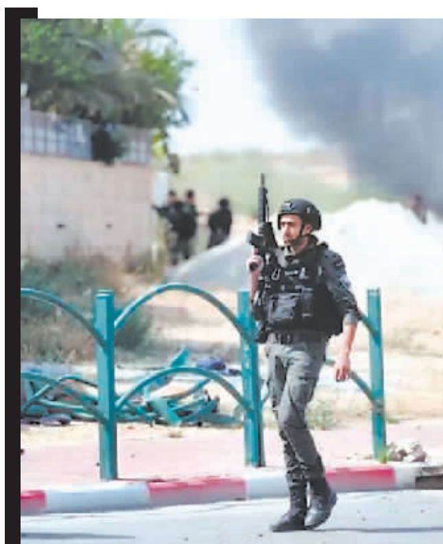
10月8日在以色列南部城镇奥法基姆拍摄的以军士兵。