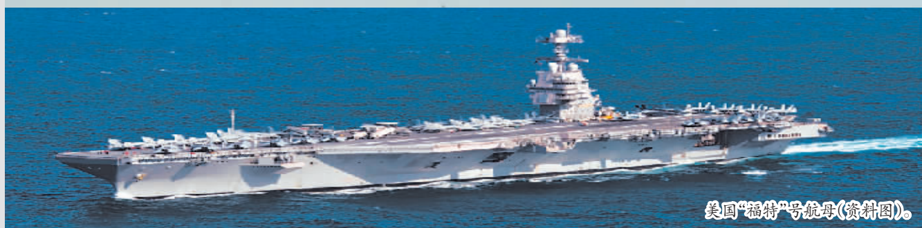
美国“福特”号航母(资料图)。