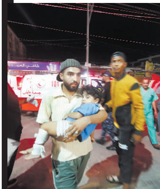
一名在以色列空袭中受伤的儿童被送到医院。