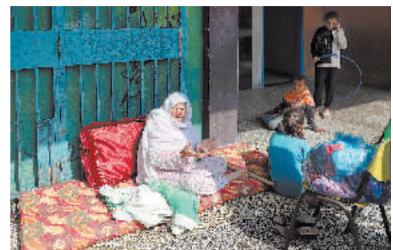
巴勒斯坦老人和儿童在加沙城一所学校躲避以色列空袭。

当地时间9日午间,耶路撒冷响起防空警报,记者听到爆炸声。以色列媒体报道说,耶路撒冷再度遭到火箭弹袭击。