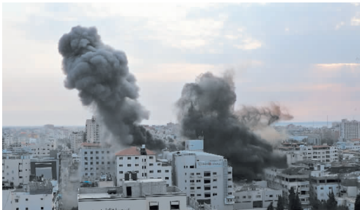
10月8日在加沙城拍摄的以色列空袭后的浓烟。

美国《华尔街日报》称伊朗伊斯兰革命卫队协助哈马斯策划奇袭,但此说法被哈马斯、伊朗和美国官员否认。