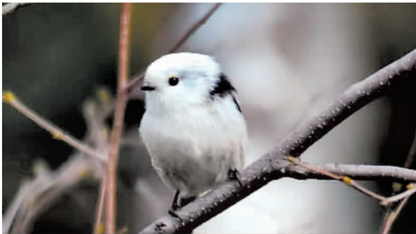
呆萌可爱的“银喉”。 【哈报手机记者】杜丽娟摄

本报讯(记者 王铁军)“麻雀还有白色的呢?还是头一回见!”近日,有市民在太阳岛湿地公园游玩时,意外发现了新奇的“白麻雀”,这种小鸟跟普通麻雀一样大小,显著的特点就是浑身白羽毛带点黑色,难道真是“白化麻雀”?