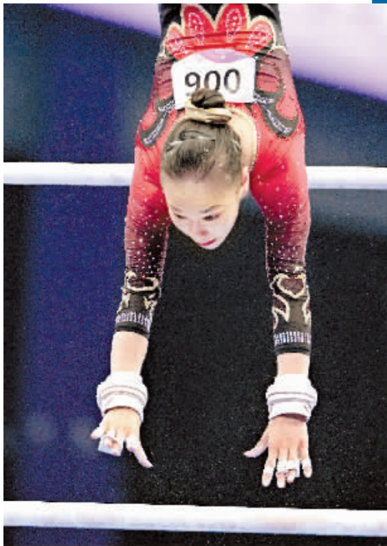
9月25日,中国选手李发彬在高低杠项目中。