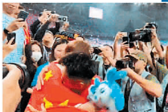
9月30日晚,杭州亚运会男子100米决赛赛后,冠军谢震业身披国旗和妻子挥泪相拥。