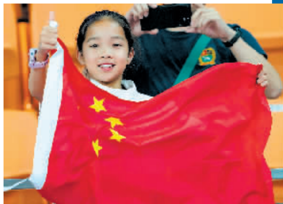
观众在颁奖仪式上为中国队选手加油。