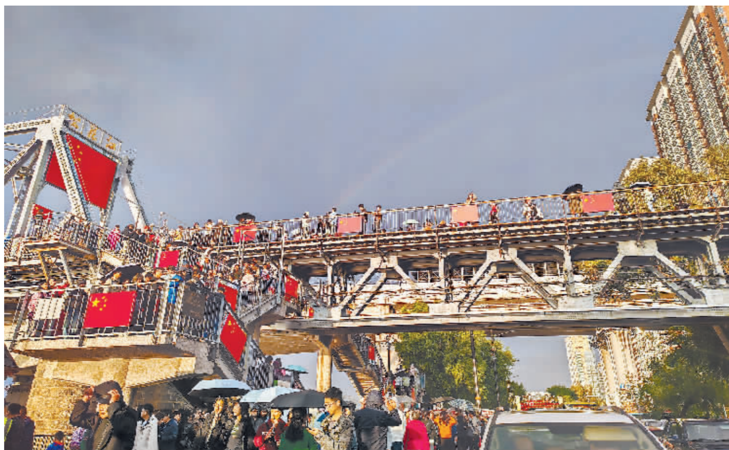
前来“国旗祝愿桥”拍照打卡的市民、游客络绎不绝。