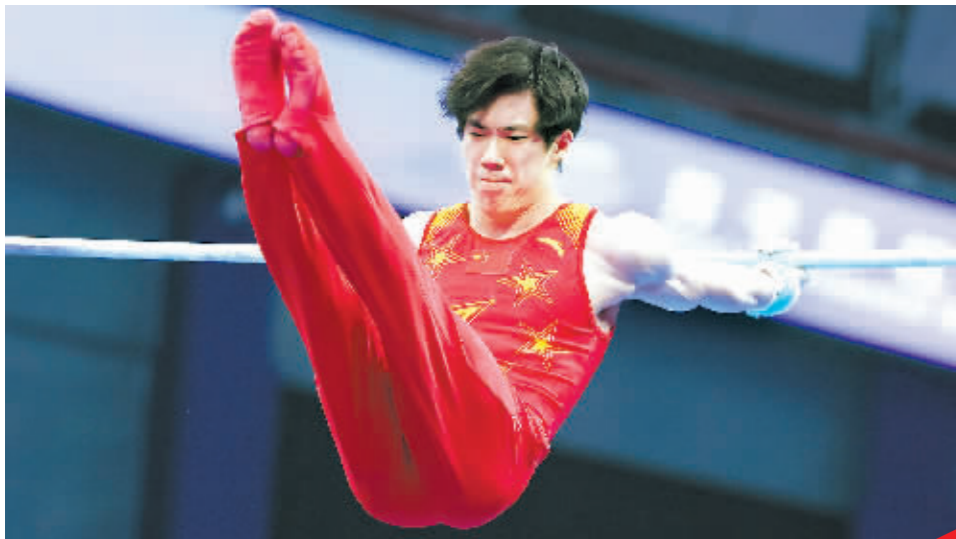
29日,在杭州亚运会竞技体操男子单杠决赛中,中国选手张博恒以15.100分的成绩获得冠军。

同时组委会还策划了丰富的中秋文化活动,如总部饭店举行“日出东方月圆亚运”西湖中秋赏月雅集;亚运村设计了两场专场演出和三场综合晚会;主媒体中心也开展中秋主题专场文化演艺项目,并推出互动游戏、非遗体验等活动。