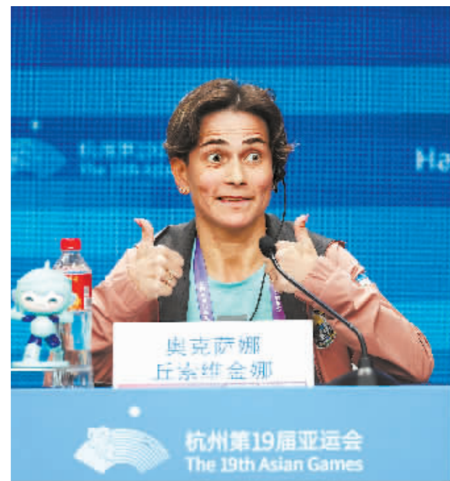
29日,丘索维金娜在发布会上。