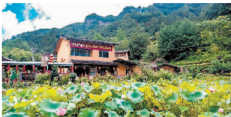
△华溪村村民开设的农家乐外景。