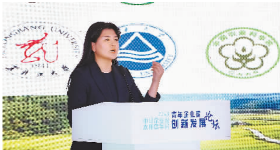
青年企业家论坛上发言。