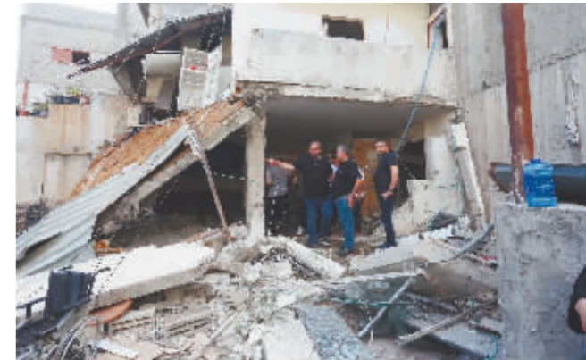
9月24日,巴勒斯坦人在冲突后查看受损建筑。

新华社拉姆安拉9月24日电 巴勒斯坦卫生部24日发表声明说,以色列军队当日在约旦河西岸城市图勒凯尔姆打死两名巴勒斯坦人。