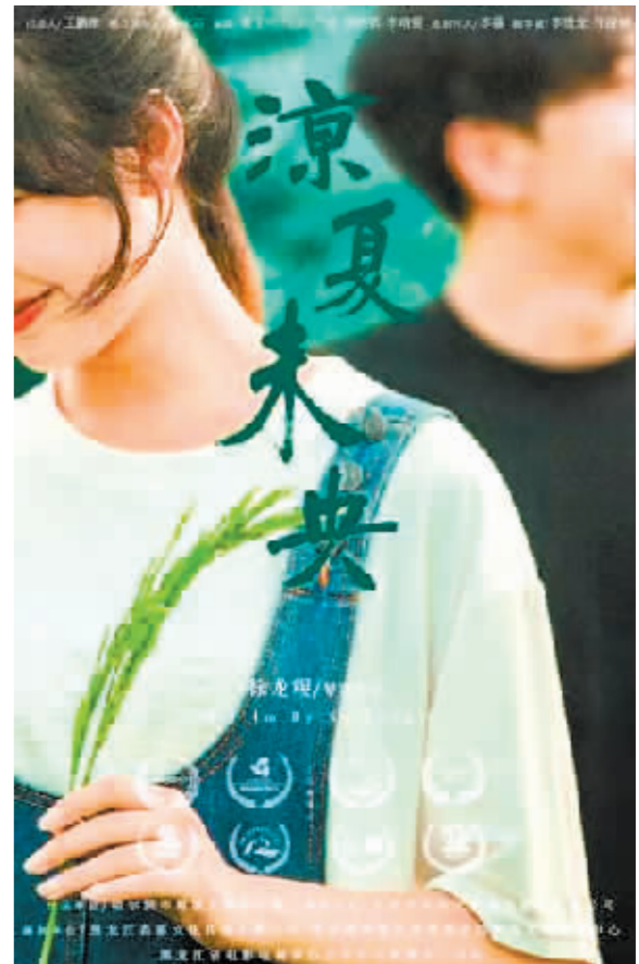
《凉夏未央》获亚洲微电影艺术节“乡村振兴单元最佳作品”。