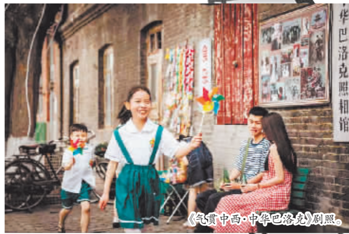
《气贯中西·中华巴洛克》剧照。