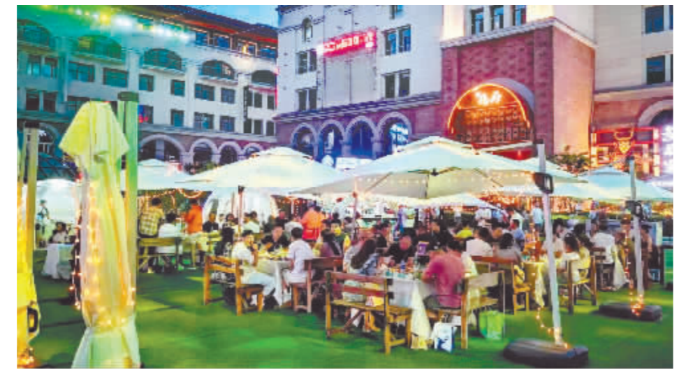
市民在火爆的“魅力道里,不夜生活”美食广场就餐。

近日,经商务部组织专家评审,哈尔滨市已成功申报国家级一刻钟便民生活圈试点。一刻钟便民生活圈是指在步行15分钟范围内,打造以满足居民日常生活基本消费和品质为目标,以多业态集聚形成的社区商业,串联起居民便利生活的“幸福圈”。市商务部门以研学用结合探索实践路径,推进哈市一刻钟便民生活圈建设。截至目前,在全市各城区设立了30个试点生活圈,生活保障类、品质提升类业态已经能够满足社区居民消费需求。随着居民消费理念转变,哈市促进消费提质升级政策显效,1至7月份,市、区共投入政府促消费资金1.49亿元,共实现销售额57.7亿元,直接拉动消费