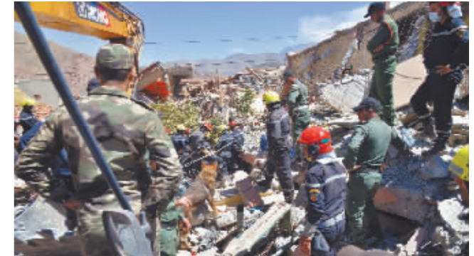
救援人员在地震废墟上搜救。

据新华社电 根据摩洛哥内政部11日晚发布的最新统计数据,该国8日晚发生的强烈地震已造成2862人遇难,2562人受伤。摩洛哥内政部说,寻找废墟下受困人员的救援行动正在进行。 据美国地质调查局地震信息消息,这次地震发生于摩洛哥当地时间8日23时11分(北京时间9日6时11分),震级为6.8级,震中位于摩洛哥城市马拉喀什西南约71公里处。摩洛哥国家地质监测机构稍晚时候公布的消息说,此次地震震级为7.0级。