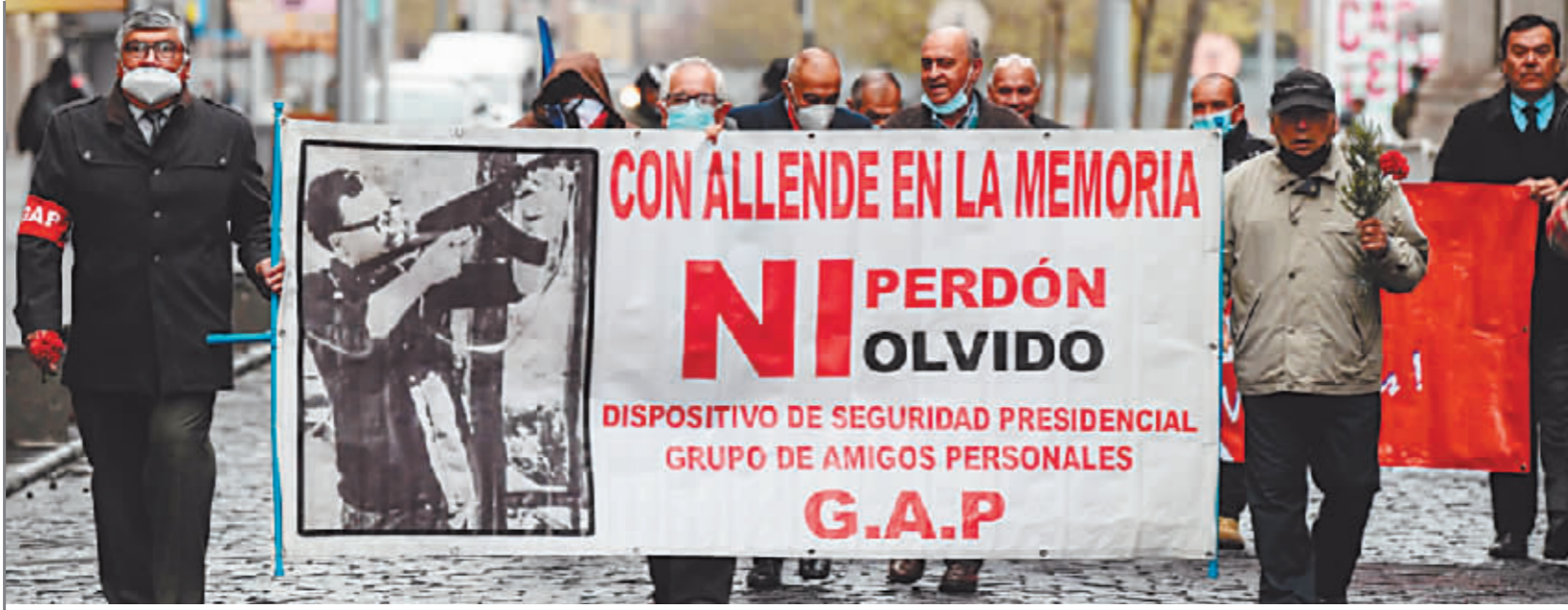
2022年9月11日,民众在智利首都圣地亚哥集会,纪念前总统阿连德遇害49周年。

“我将以生命捍卫祖国的宝贵原则。” 1973年9月11日,智利首都圣地亚哥,在被政变军人包围的总统府,来自左翼阵营的智利总统萨尔瓦多·阿连德发表广播讲话,表达战斗到底的决心。当天晚些时候,总统府被攻占,阿连德殉职。 “这场政变翻开了智利历史上最黑暗的章节之一。”古巴拉丁美洲通讯社一篇报道这样评价。 今年9月11日是阿连德政府遭政变推翻50周年纪念日。半个世纪以来,许多历史研究和解密档案显示,美国在阻止阿连德上台和颠覆阿连德政府的过程中费尽心机、不择手段。今年也是美国提出“门罗主义”200年。长期以来,美国抱持霸权主义,操纵“民主自由”话术,利用政变干涉、经济制裁等手段,给拉美国家和人民造成深重苦难。如今,越来越多的拉美国家和人民正在觉醒,反对美国霸权干涉的呼声日益高涨。