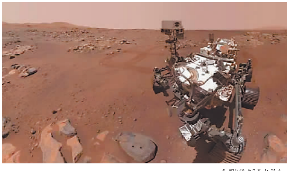
美国“毅力”号火星车。

据新华社电 据美国航天局网站消息,美国“毅力”号火星车搭载的制氧设备近日完成在火星上最后一次制氧实验,相关技术被验证是能为未来登陆火星的宇航员提供氧气和返程火箭推进剂的可行技术。 这台名为“火星氧气就地资源利用实验(MOXIE)”的设备随“毅力”号火星车于2021年登陆火星。其工作原理是通过电化学反应产生氧气分子,即从火星稀薄的大气中提取二氧化碳,从二氧化碳分子中分离出氧原子,最终生成氧气。系统通过分析气流,可以测算出制氧量和氧气纯度。 美国航天局介绍,自登陆火星以来,该设备已完成16次制氧实验,总共成功产生了122克氧气,相当于一只小狗呼吸10小时所需氧气量。在最高效率情况下,该设备每小时能够产生12克纯度不低于98%的氧气,这个制氧量是美国航天局最初设定目标的两倍。8月7日,该设备在第16次制氧实验中产生了9.8克氧气。 美国航天局表示,该设备成功达到了所有技术要求,能够在在一个完整火星年的各种条件下运行。 美国航天局相关任务负责人特鲁迪·克尔泰什说,相关设备和技术能够就地取材,将火星当地资源转化为未来空间探索任务所需的产品,通过在现实条件下验证这项技术,我们距离让宇航员在火星“以当地资源为生”又近了一步。 据介绍,美国航天局在MOXIE任务后的下一步计划是研发在制氧外还包括液化和储存氧气等功能的系统。