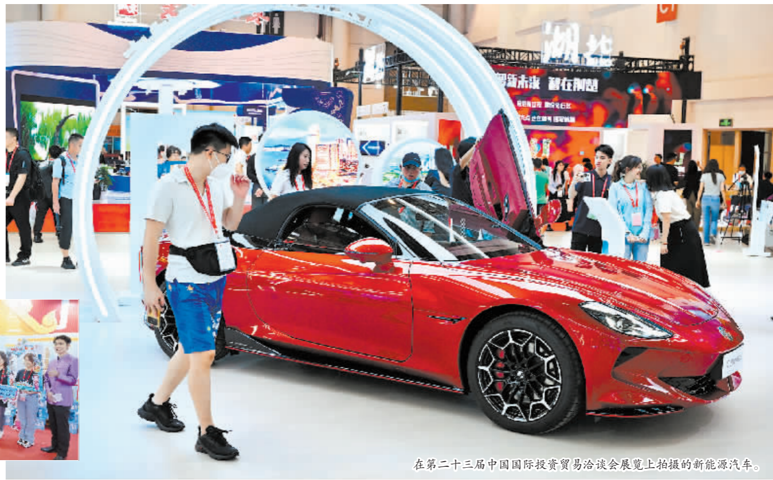
在第二十三届中国国际投资贸易洽谈会展览上拍摄的新能源汽车。