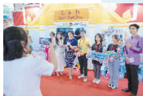
中外嘉宾在泰国展区前合影。

志合者，不以山海为远。面对不确定的世界经济形势，如约而至的盛会，唱响开放之音，拉紧团结之手，展现中国扩大双向投资的坚定决心，激荡共促全球发展的澎湃动能。