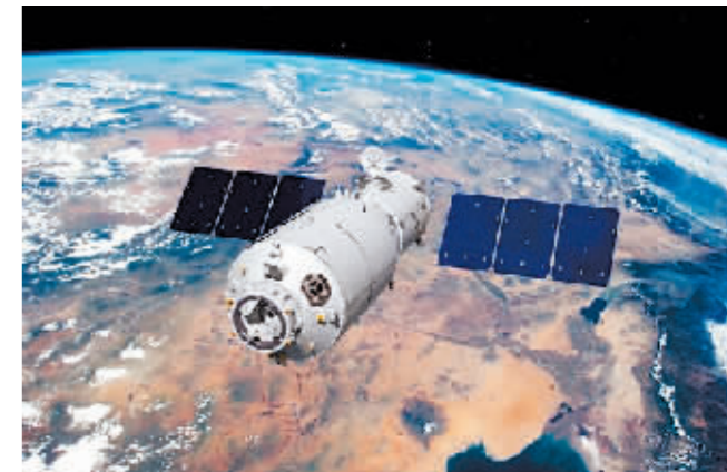
天舟五号货运飞船模拟图。

新华社北京9月11日电 记者从中国载人航天工程办公室了解到，9月11日16时46分，已完成全部既定任务的天舟五号货运飞船，顺利撤离空间站组合体，转入独立飞行，将按计划于9月12日受控再入大气层，货运飞船绝大部分器件将在再入大气层过程中烧蚀销毁，少量残骸将落入南太平洋预定安全海域。