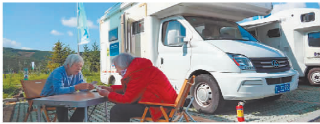
9月1日,游客在鹿角湾温泉度假营地露营。

在阿尔山市鹿角湾温泉度假营地,秋日的脚步逐渐靠近,夕阳西下,晚风徐徐,自驾游客正在悠然自得地做饭、打扫爱车。