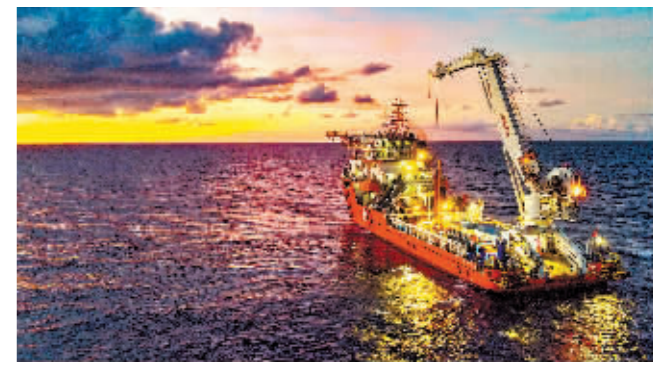
海洋温差能发电装置搭载“海洋地质二号”船进行海上试验。

新华社广州9月11日电 海洋温差能是重要的海上新能源,也是当前全球新能源研究的重要领域。中国地质调查局广州海洋地质调查局牵头研发的20kW海洋漂浮式温差能发电装置近日在南海成功完成海试,返回广州南沙。这是我国首次在实际海况条件下实现海洋温差能发电原理性验证和工程化运行,有力推进我国深海能源开发利用。