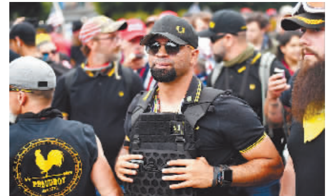
这是恩里克·塔里奥在美国俄勒冈州波特兰参加集会的资料照片。

据新华社电 美国华盛顿联邦地区法院5日判处极右翼组织“骄傲男孩”前头目恩里克·塔里奥22年监禁,是对“国会山骚乱”案被告人迄今最重刑罚。