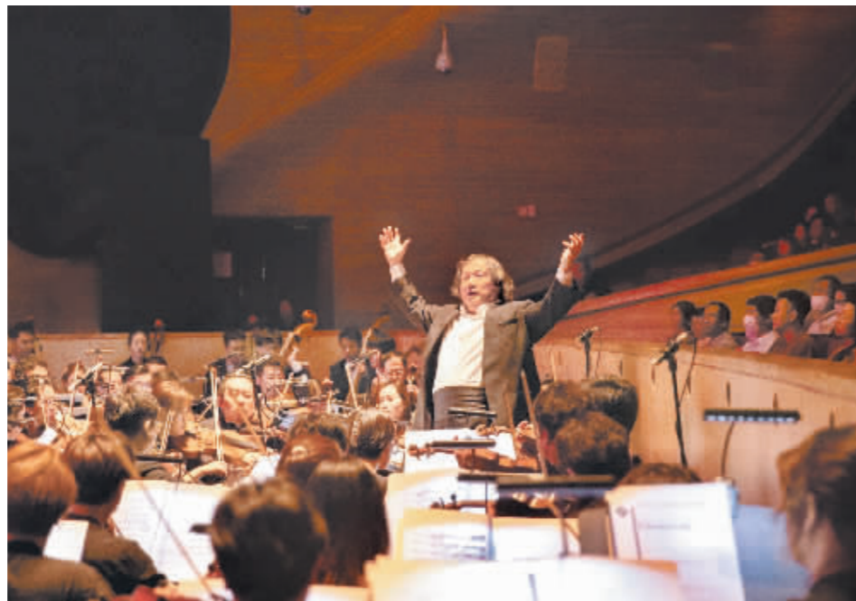
汤沐海携手哈响与哈芭联袂演出芭蕾舞剧《胡桃夹子》。

发展中心、中国文化馆协会、哈尔滨市文化广电和旅游局共同主办的“合唱指挥培训班”在哈举办，前来授课的中国合唱协会理事长李培智说，他年轻时就知道哈尔滨之夏音乐会。“现在很多城市致力打造‘音乐之都’‘歌城’等，哈尔滨有着优秀的音乐传统与底蕴，很了不起。许多在音乐界有影响的艺术家都是从哈尔滨走出来的，如著名歌唱家金铁霖、田玉斌等。一说哈尔滨，就是好嗓子的感觉。”