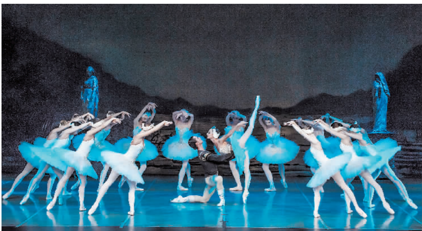
9月5日，芭蕾舞剧《天鹅湖》在哈尔滨大剧院精彩上演。