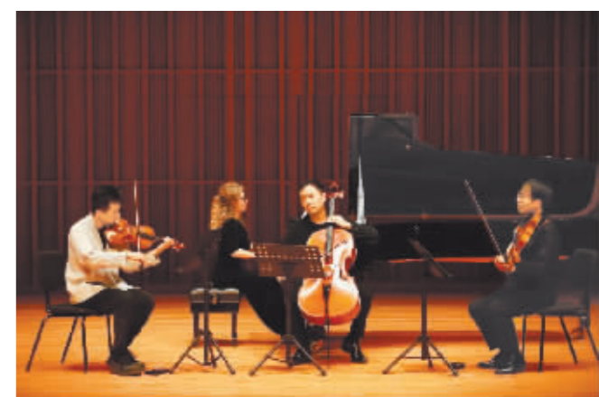
哈尔滨音乐学院师生参加哈夏音乐会演出。