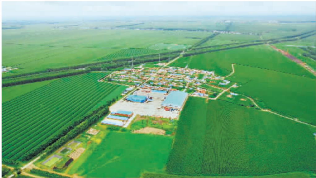
高标准农田建设有力地保障了丰收高产。

质大米对接“工尾”提档升级,闯出了“巴彦大米”品牌,“小村企”被评为市级重点建设项目,同时被授予“示范加工企业”称号。