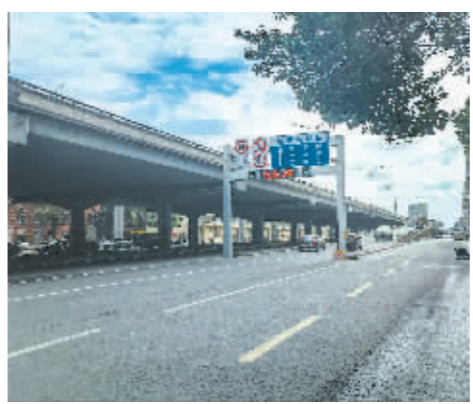
新阳路与康安路上桥处试行“临时匝道管控”。

哈市交通运输局将岛内的5处公交站台共计17条线路迁移至岛外,以消除公交车停靠对环岛内车流的影响。市住建局通过削减红旗大街与中山路环岛边缘,增加行人车道路断面宽度,使人岛车辆行驶更加顺畅。为避免行人桥下穿行,市城投集团还在公滨路桥下公共停车场安装了高护栏,以提高桥下道路通行能力。