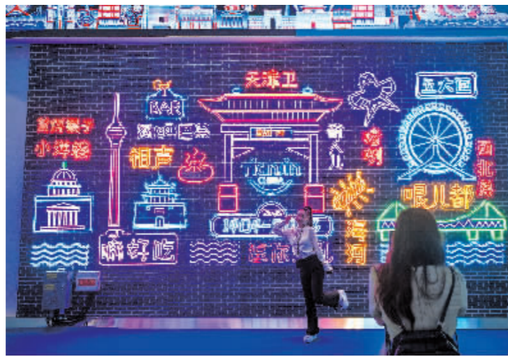
观众在一处景观墙打卡。