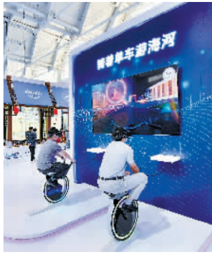
观众体验VR 海河骑行。