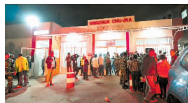
图为踩踏事故发生后,人们聚集在马达加斯加首都塔那那利佛一家公立医院外。