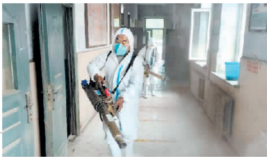
图为尚志市希望中学对教学楼进行消杀。

开学上课。记者从尚志市珍珠山学校获悉,受前期强降雨影响,学校操场遭遇洪水侵害,其中低洼处水深达到60厘米。经过初步统计,学校教学楼一楼4间实验室,以及卫生保健室、教学楼大厅、教师办公室等7处地面塌陷,黑板、电脑、监控等教学设备受损。为确保如期开学,该校不等不靠,在主管部门指导下积极开展灾后损毁校舍恢复重建工作。除对塌陷房屋地面进行抢修处理,对教学楼、操场等过水处进行排涝、清洗、消杀外,每天两次对整个校园进行消杀,确保师生安全返校、如期开学。