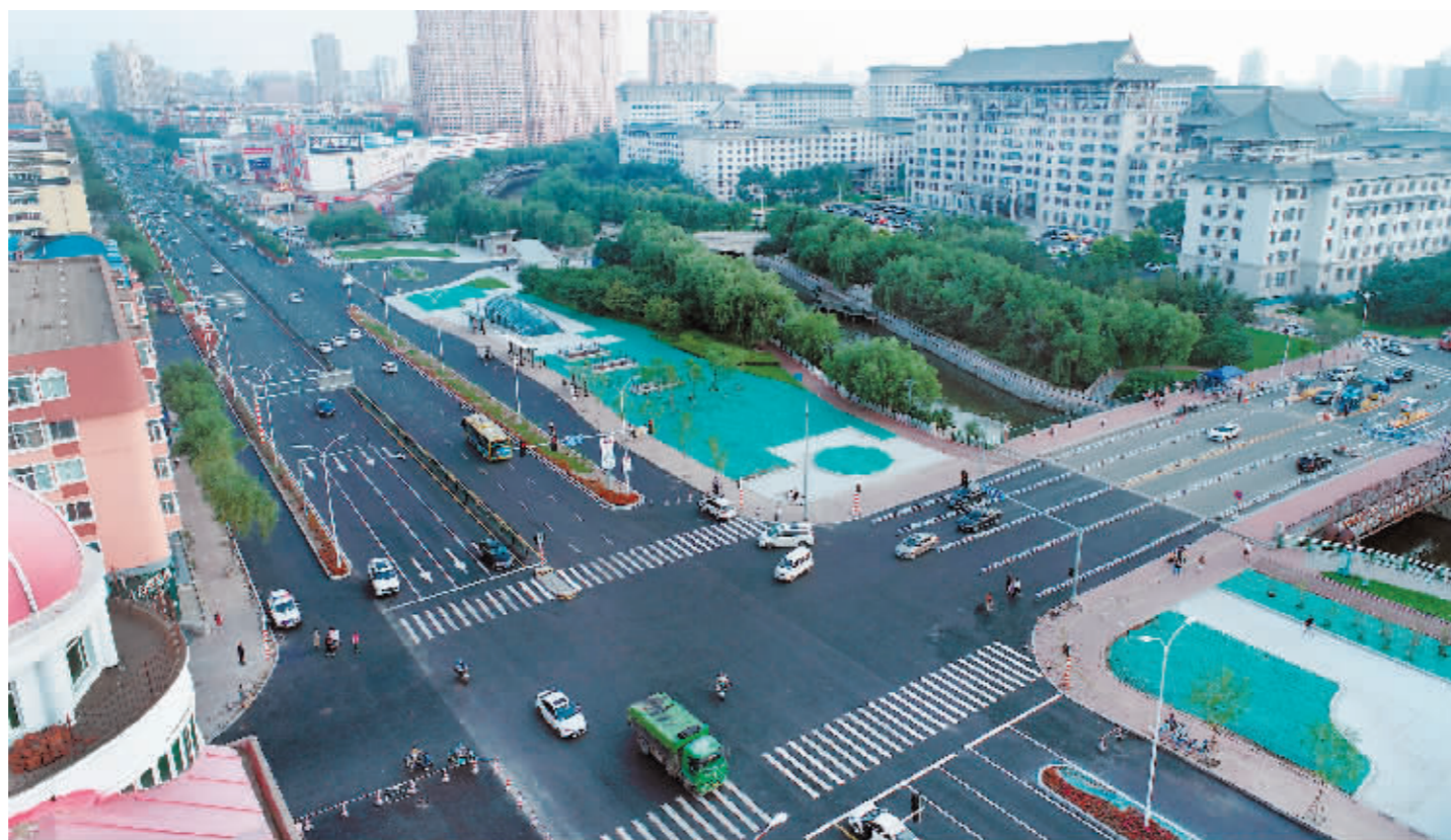
红旗大街道路更新改造项目车行道铺装完工并通车。

本报讯(实习生 秦艺鸣 记者 刘述波)“红旗大街更新改造后,路面平坦宽敞,现在在这条路上开车不但舒适平稳,还更顺畅了。”家住红旗新区的市民武先生高兴地说。8月26日,记者从市住建局获悉,在50余天施工期间,该局克服频繁降雨等天气不利因素昼夜施工,高标准推进项目建设,目前红旗大街道路更新改造项目7.5公里车行道铺装已全线完工并顺利通车,5.8万平方米人行道改造项目也已完成过半,预计9月中旬完成全部施工。红旗大街更新改造是今年哈尔滨市推进的城市样板街路改造重点项目。记者在现场看到,整饬一新的道路标线醒目,路面平坦宽敞,行车更为舒适、平稳和顺畅。