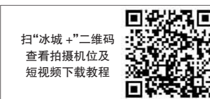
扫“冰城+”二维码 查看拍摄机位及短视频下载教程

友,全马和半马共设10个机位(全马和半马各设有6个拍摄机位,其中两个为全马和半马共用机位),如果您想获得质量更高的专属小视频,请务必在摄像机前露出完整的号码牌,并摆出您最美的姿态!我们在这些点位等您哦!