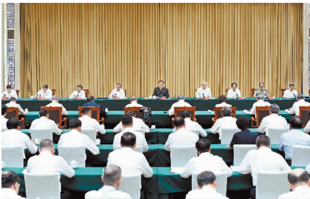
8月26日,中共中央总书记、国家主席、中央军委主席习近平在结束出席金砖国家领导人第十五次会晤并对南非进行国事访问回国后,在乌鲁木齐专门听取新疆维吾尔自治区党委和政府、新疆生产建设兵团工作汇报,发表了重要讲话。