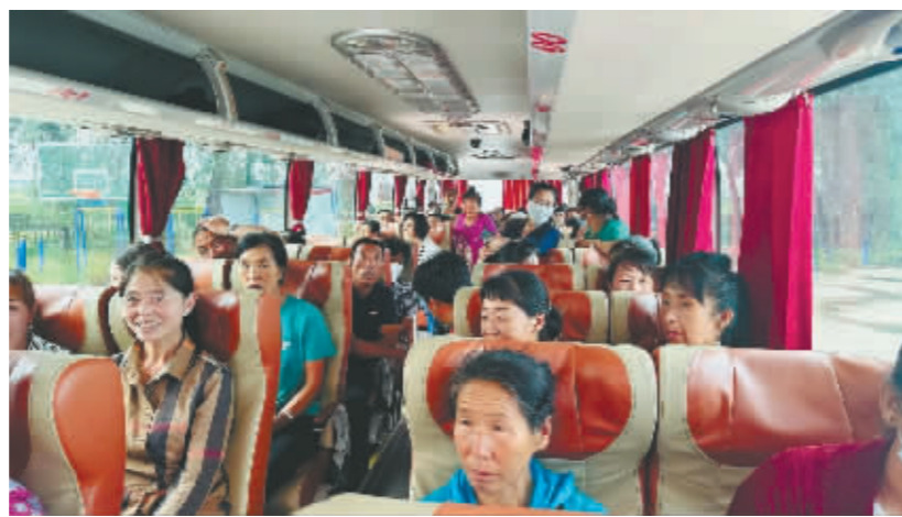
企业大巴车接群众组团“看活儿”。

截至目前,“干活中介”已经在受灾的13个屯里发布就业信息18条,零工类招工共160余人。