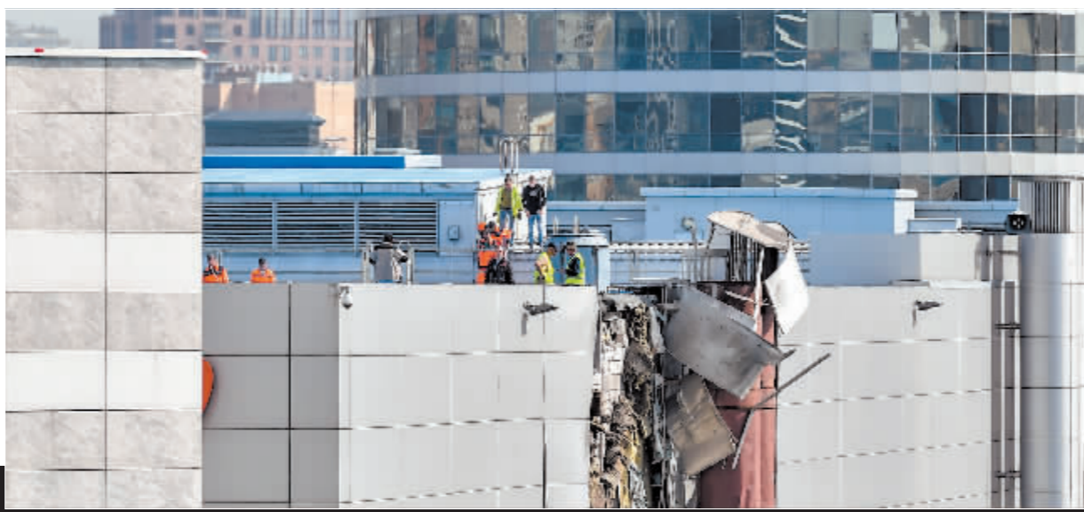
8月18日在俄罗斯莫斯科拍摄的受损建筑。

莫斯科市市长索比亚宁当天早些时候在社交媒体上发文说,当天凌晨一架无人机在飞往莫斯科途中被防空系统击落。无人机残骸坠落在莫斯科国际展览中心区域,没有对建筑物造成重大破坏。无人机坠落没有造成人员伤亡,紧急情况部门在现场进行了处置。