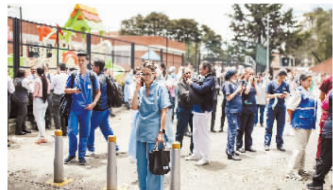
人们在地震发生后的街头避难。

据新华社电 哥伦比亚中部塔梅拉省17日12时04分(北京时间18日1时04分)发生6.1级地震,包括首都波哥大在内,全国大部分地区震动明显。除一名妇女跳楼逃生坠亡,地震未导致重大人员伤亡。