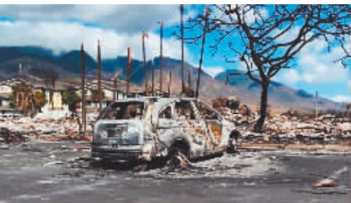
野火烧毁的建筑和汽车残骸。

美国夏威夷毛伊岛野火灾区失联人员搜寻工作仍在进行,在灾难中失去房屋的不少居民已收到地产机构的问询——有意从灾民手中收购地皮。