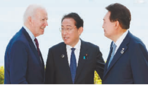
5月21日,G7领导人峰会期间,拜登、岸田文雄和尹锡悦会谈。

分析人士指出,美方积极推动此次会谈,旨在进一步拼凑与日韩两国的“小圈子”,鼓动阵营对抗,把他国战略安全作为维护美式霸权的垫脚石,恐将严重威胁亚太地区和平、稳定与繁荣。