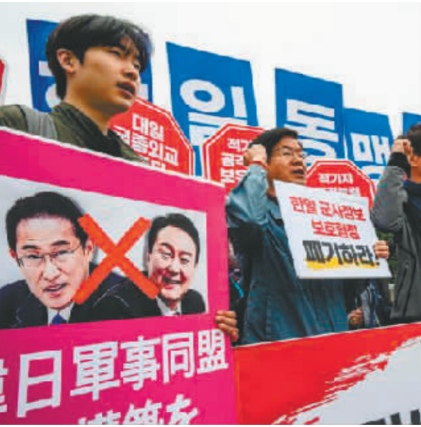
韩国民众5月6日在首尔举行抗议集会,反对岸田文雄访韩。