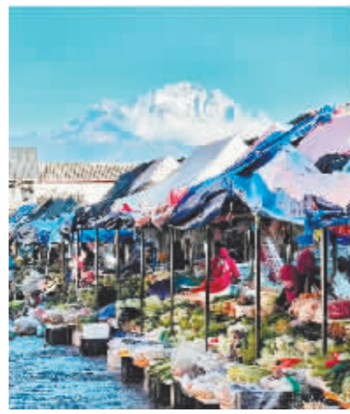
网友分享的丽江忠义市场。

另一类人打卡菜市场的目的是出片。丽江的忠义市场能望见雪山；大理的北门菜场因为背篓里10元三把的鲜花而闻名；苏州的双塔市集，文创摊位和江浙特色美食区每天都会吸引很多外地来的年轻人拍照打卡；合肥九华山路菜市场以“徽风皖韵”为主题，古色古香的木质门头、青砖黛瓦的徽派建筑风格，让菜市场成了一场“网红”打卡点。菜场变成了景区，这里是年轻人另辟蹊径的拍摄地。