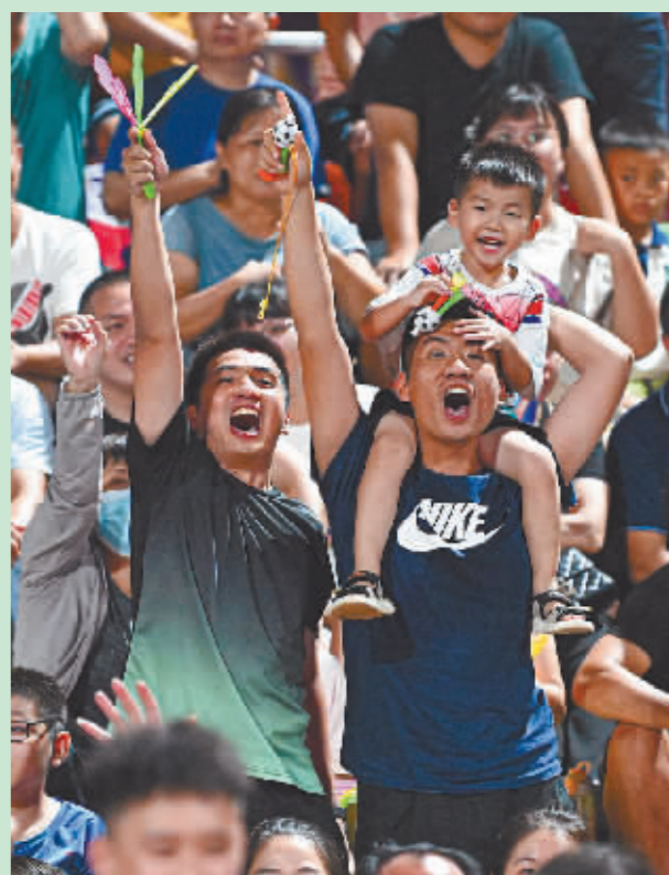
观众在场边呐喊助威。