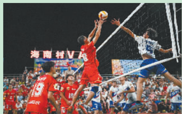
在“村排”决赛中，东郊镇队(右)对阵东阁镇队。

如今文昌设有600多个排球场，排球也已融入文昌人的生活。“村排”热潮虽已落幕，当地百姓对排球的挚爱之情却永久激荡。