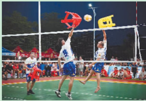
球员们表演具有文昌特色的“凳子排球”。