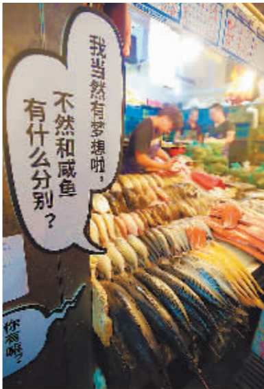
北京三源里菜市场里的水产商户在展示自家的生活艺术。