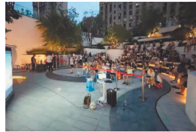
居民在小区内观看露天电影。

本报讯(实习生 秦艺鸣 记者 刘述波)一块幕布、一台投影机、一排排小凳子,左邻右舍相约在小区广场空地上或大堂内观看露天电影,享受独属暑期的夜晚时光。近日,在汇龙巴黎第九区、柒零捌零小区和水木清华等小区内,物企陆续开展了丰富多彩的露天电影节主题活动。