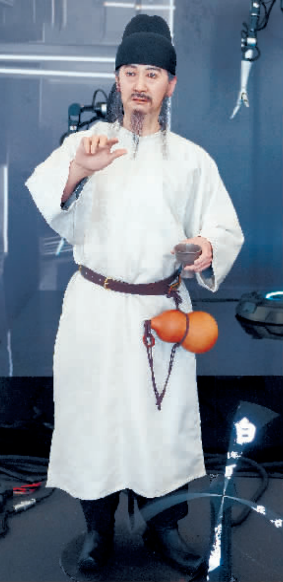
仿诗人李白的仿生人形机器人在大会上表演。