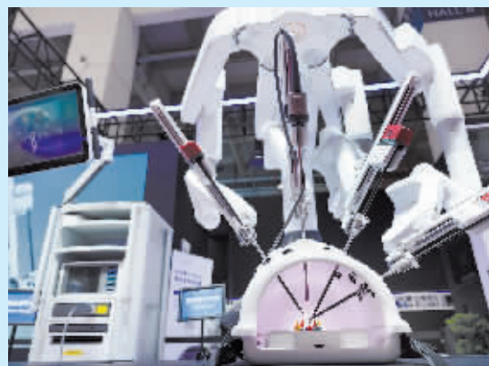
机器人模拟做医疗手术。