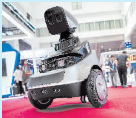
具有防火防盗功能的巡逻机器人在执勤。

8月16日,2023世界机器人大会在北京开幕,本次大会的主题为“开放创新 聚享未来”,包含论坛、博览会、机器人大赛等活动。