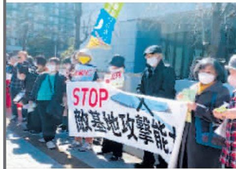
2023年2月28日,日本民众抗议日本众议院通过高额的防卫预算案。

战、太空安保等新内容,合作领域从原来的9个增加到16个。不过,此次会议上,颇受关注的北约在日设立联络处提议,因法国等反对未获通过。岸田北约峰会之行遭到不少日本民众强烈反对,抗议者批评北约是战争集团,只会给世界和平带来威胁,岸田政府与北约频繁互动是在把战争引入亚太。藤泽厚表示,日本接近北约、制造亚洲地区紧张局势的行为,违背了45年前日中缔结和平友好条约时对中国的承诺。