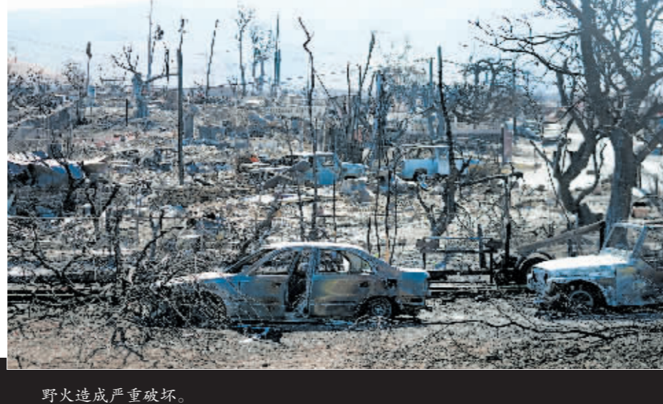
野火造成严重破坏。

据新华社电 美国夏威夷州毛伊岛日前发生百年来“最致命”野火,迄今已致96人死亡。随着搜寻和救援继续,死亡人数恐进一步上升。当地不少民众告诉媒体记者,他们没有收到预警信息,警报系统也没有响应,政府部门应对灾情不力。