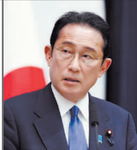
日本首相岸田文雄。

三原则”取代,如今“三文件”提出修改“防卫装备转移三原则”及其细则,试图大幅放宽武器出口限制。日本扩军备战的种种迹象引发日本舆论批评和民众担忧。日本反战和平组织“和平构想建言会”发表声明说,“三文件”将使日本再次成为能够发动战争的国家,从而在东亚煽动军备竞赛,是极其危险之举。日本山口大学名誉教授藤泽厚认为,“三文件”将加剧日本与亚洲邻国之间的紧张关系。