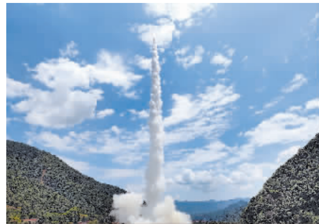
8月14日13时32分,我国在西昌卫星发射中心使用快舟一号甲运载火箭,将和德三号A-E星等5颗卫星发射升空,卫星顺利进入预定轨道,发射任务获得圆满成功。