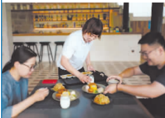
浙江一家民宿内,工作人员为住客提供分餐制早餐。