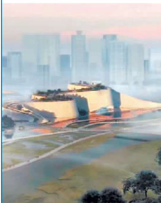
深圳市自然博物馆效果图。