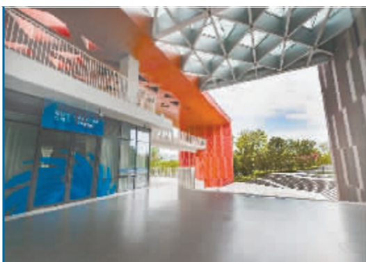
在成都大运村内拍摄的“冷巷”建筑。