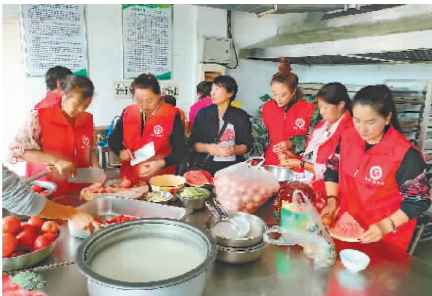
安置点工作人员为居民准备可口的饭菜。

本报讯(曹群 记者 张大星)“涨水了,亮珠河的水头要过来了。”随着汛情来临,延寿县中和镇党委全体党员干部立即组成专班,进入中和村兴国屯、胜利村胜利屯、崇和村永和屯,组织 210 户 545 名居民全部从家里撤离,转移到安全场所。与此同时,镇党委以女干部为主的党员志愿服务保障组在中学安置点准备好毛巾、开水,做好了可口饭菜,迎接转移群众的到来。