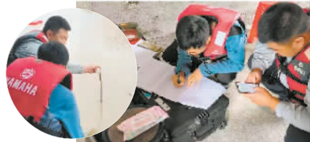
工作人员严密监测水雨情。

本报讯(李刚 记者 张大星)连日来,哈尔滨水文分中心所辖尚志、一面坡、延寿等水文站均不同程度进水,老街基观测场地相关设施被冲走,停电、停水、断网,给水文监测工作带来巨大难题。