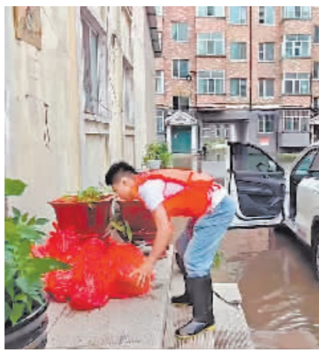
志愿者运送保障物资。

在尚志市东方花园、东和小镇、红旗新村等小区,工作人员为行动不便和暂时被困家中的群众配送基本生活物资 1200 余件,包括牛奶、面包、火腿肠、矿泉水等。抽调人员将这些物资发放到各小区物业和社区工作人员手中,再由物业和社区的工作人员逐一送到居民家中,并安抚受困群众情绪,及时保障群众的基本生活,确保受困群众“有饭吃、有水喝”。